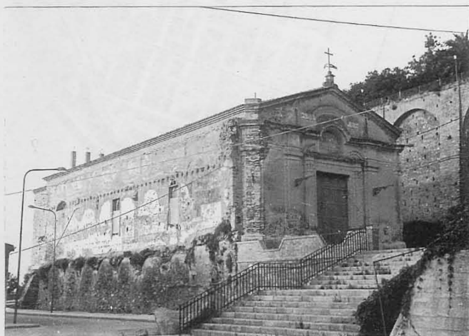
Chiesa dei Monaci