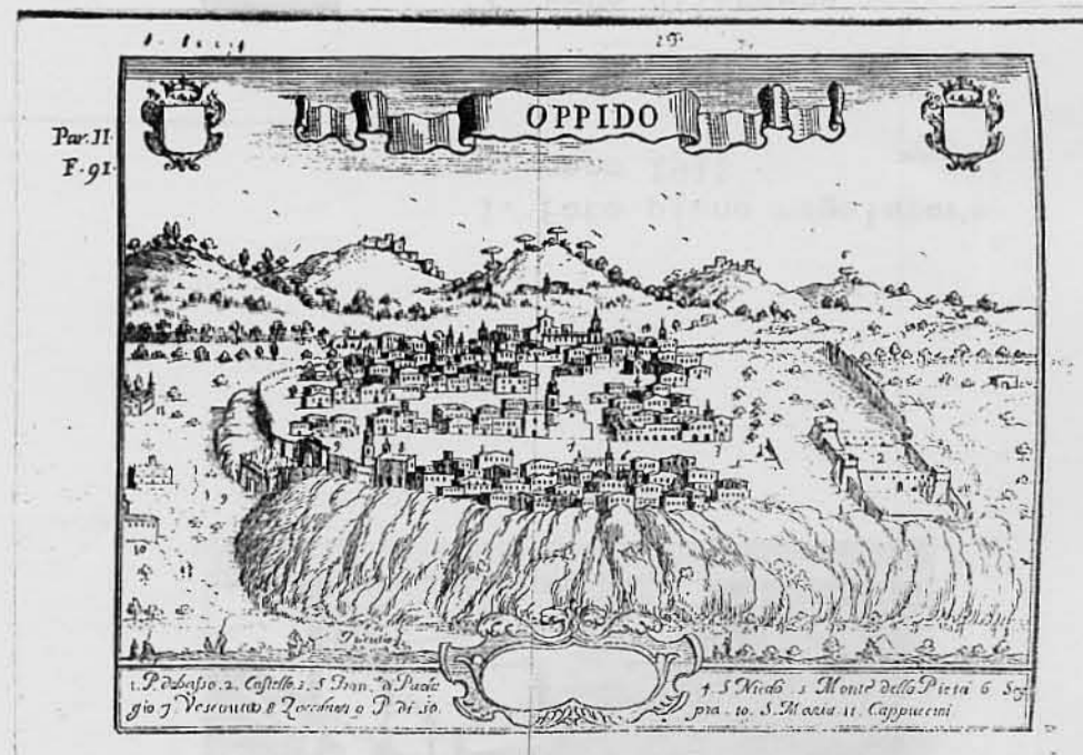
Stampa sec.XVII da "Pacichielli - Il regno di Napoli in prospettiva - NA 1703"