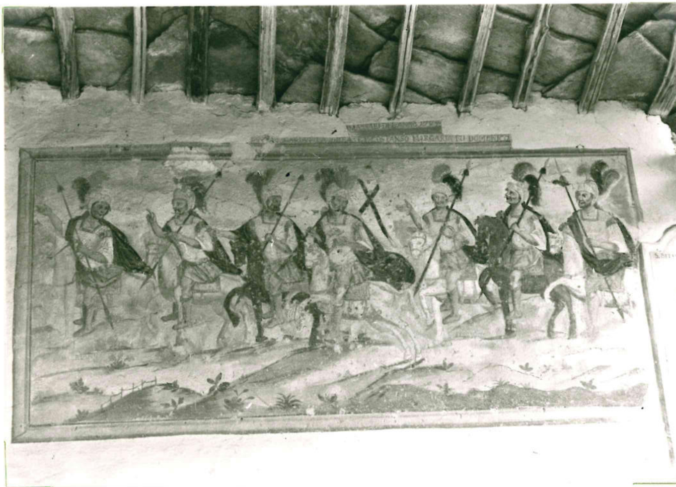
Portico, parete destra: affresco datato al 1794 raffigurante i martiri della Legione Tebea.

(5605238) Roma, 1975 - Ist. Poligr. Stato - S. (c. 400.000)