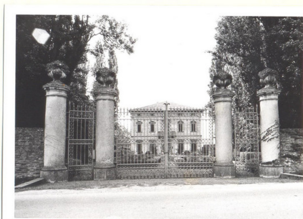
4) VEDUTA DALLA STRADA