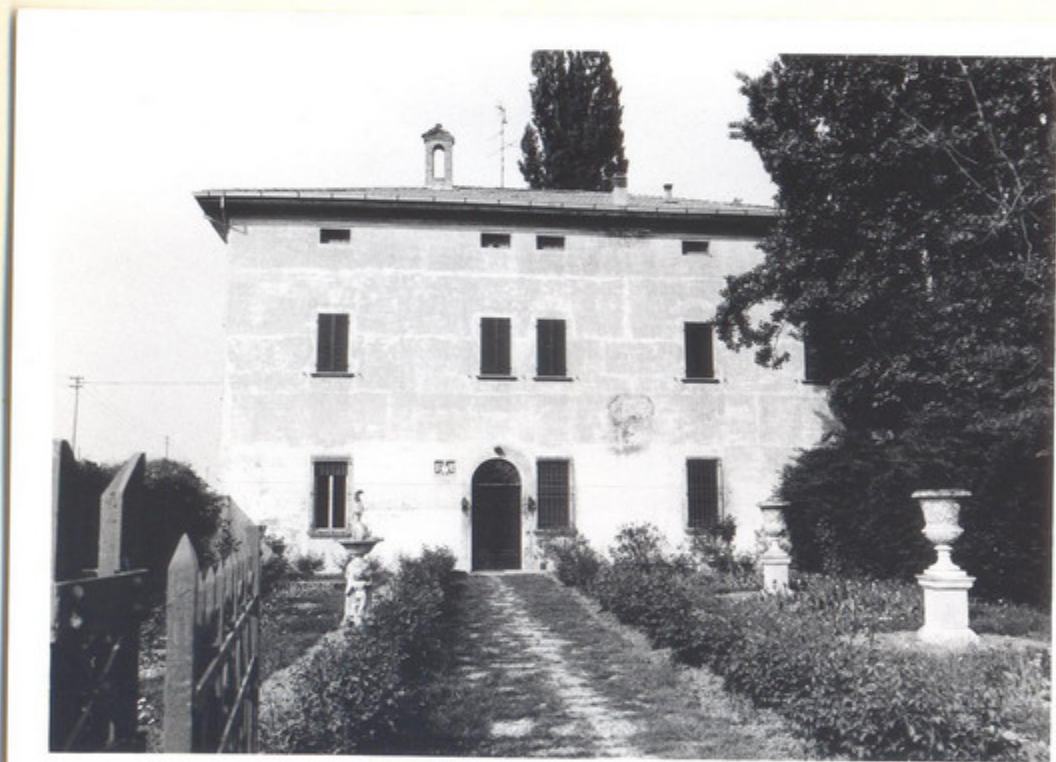
3) PROSPETTO LATERALE

(5605238) Roma, 1975 - Ist. Poligr. Stato - S. (c. 400.000)