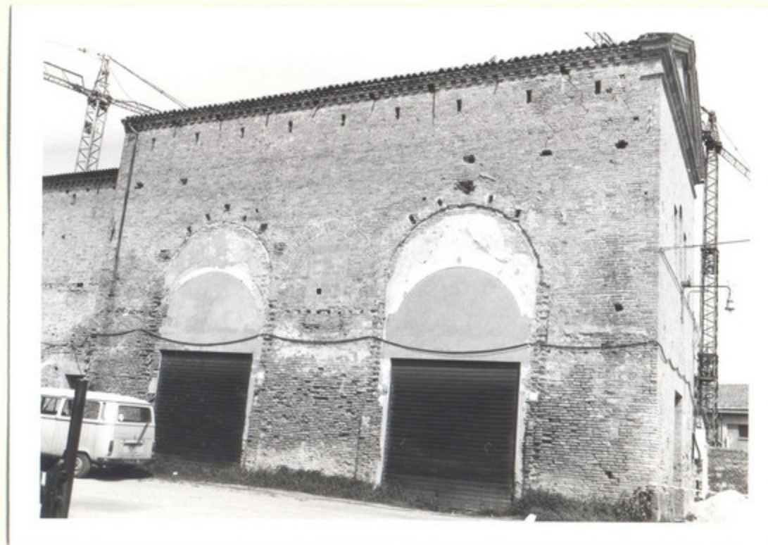
2) LATO SUD 62505