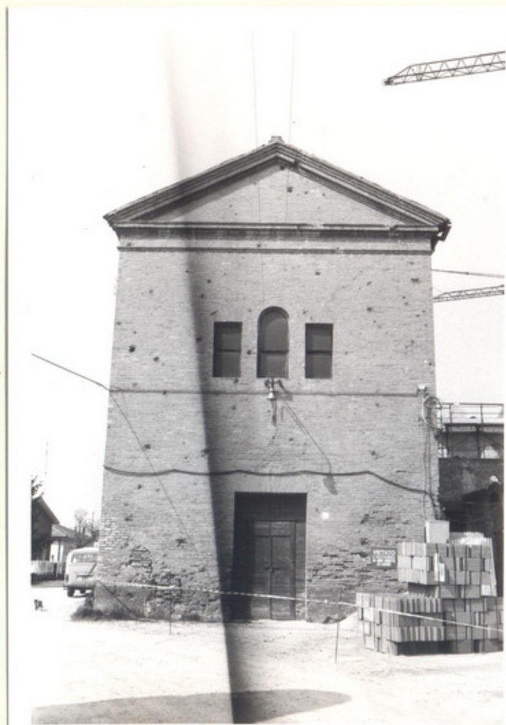
1) PROSPETTO PRINCIPALE 62504

(5605238) Roma, 1975 - Ist. Poligr. Stato - S. (c. 400.000)