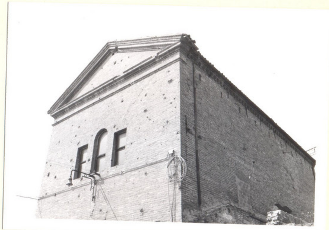
4) LATO NORD