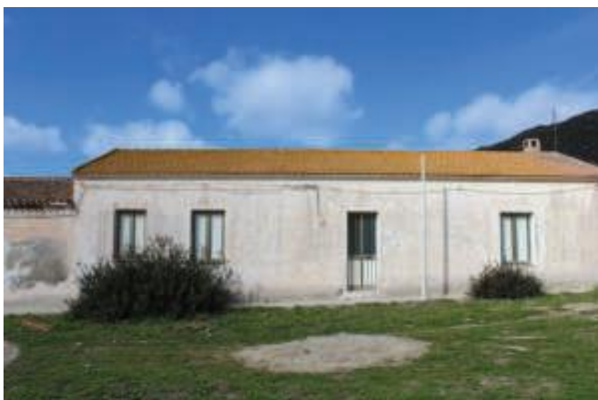
Immobile denominato "Ex Alloggi" a Cala Reale nell'Isola dell'Asinara: vista anteriore di un alloggio