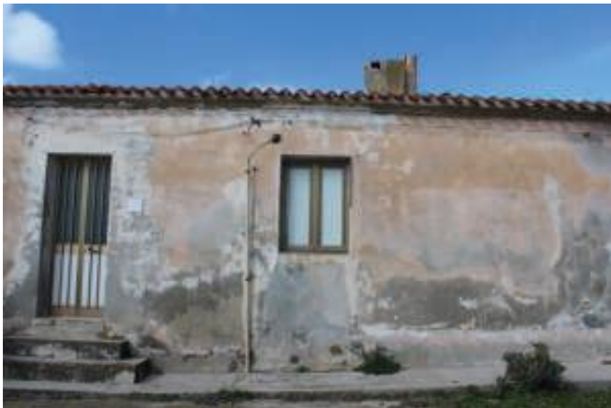
Immobile denominato "Ex Alloggi" a Cala Reale nell'Isola dell'Asinara: vista anteriore di un alloggio