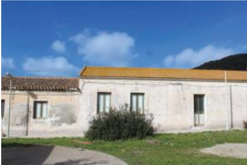
Immobile denominato "Ex Alloggi" a Cala Reale nell'Isola dell'Asinara: vista anteriore dei corpi di fabbrica giustapposti

DIREZIONE GENERALE ARCHEOLOGIA, BELLE ARTI E PAESAGGIO SOPRINTENDENZA ARCHEOLOGIA, BELLE ARTI E PAESAGGIO PER LE PROVINCE DI SASSARI E NUORO