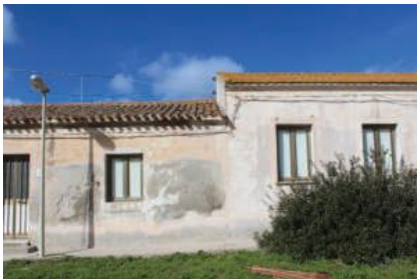
Immobile denominato "Ex Alloggi" a Cala Reale nell'Isola dell'Asinara: vista anteriore dei corpi di fabbrica giustapposti

DIREZIONE GENERALE ARCHEOLOGIA, BELLE ARTI E PAESAGGIO SOPRINTENDENZA ARCHEOLOGIA, BELLE ARTI E PAESAGGIO PER LE PROVINCE DI SASSARI E NUORO