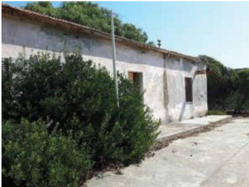
Immobile denominato "Ex Ufficio Postale" a Cala Reale nell'Isola dell'Asinara: prospetto del corpo principale, lato uffici