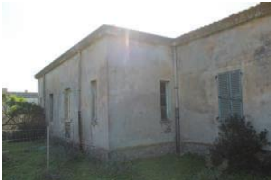
Immobile denominato "Ex Ufficio Postale" a Cala Reale nell'Isola dell'Asinara: prospetto posteriore, corpo aggiunto

DIREZIONE GENERALE ARCHEOLOGIA, BELLE ARTI E PAESAGGIO SOPRINTENDENZA ARCHEOLOGIA, BELLE ARTI E PAESAGGIO PER LE PROVINCE DI SASSARI E NUORO