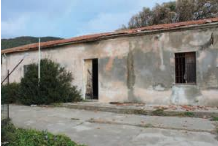
Immobile denominato "Ex Ufficio Postale" a Cala Reale nell'Isola dell'Asinara: prospetto del corpo principale con ingresso agli uffici

DIREZIONE GENERALE ARCHEOLOGIA, BELLE ARTI E PAESAGGIO SOPRINTENDENZA ARCHEOLOGIA, BELLE ARTI E PAESAGGIO PER LE PROVINCE DI SASSARI E NUORO