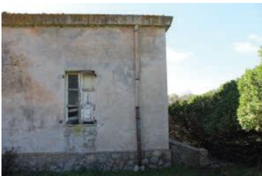
Immobile denominato "Ex Ufficio Postale" a Cala Reale nell'Isola dell'Asinara: prospetto posteriore, corpo aggiunto