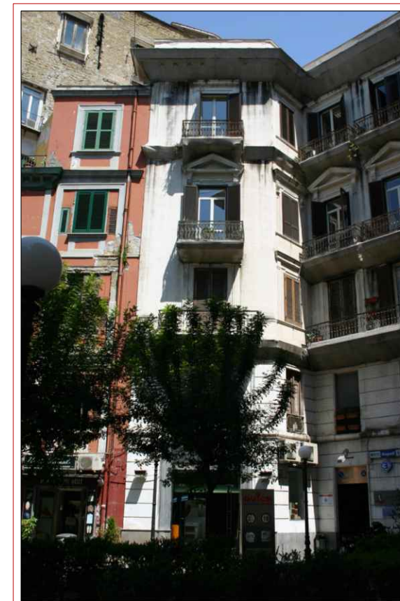
foto 3 - Prospetto sulla piazzetta Domenico Morelli