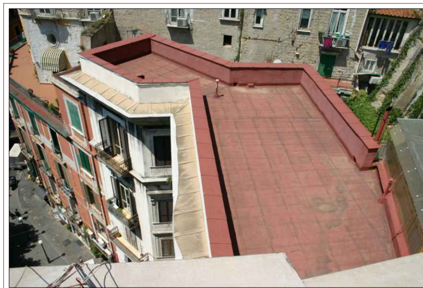
foto 2 - Lastrico solare