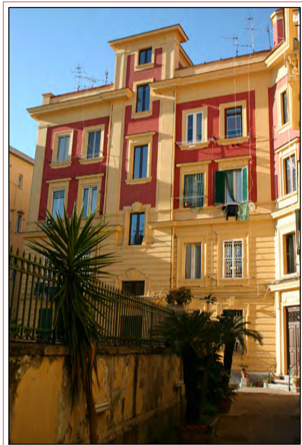
foto 5-PROSPETTO NORD-EST CORTILE INTERNO