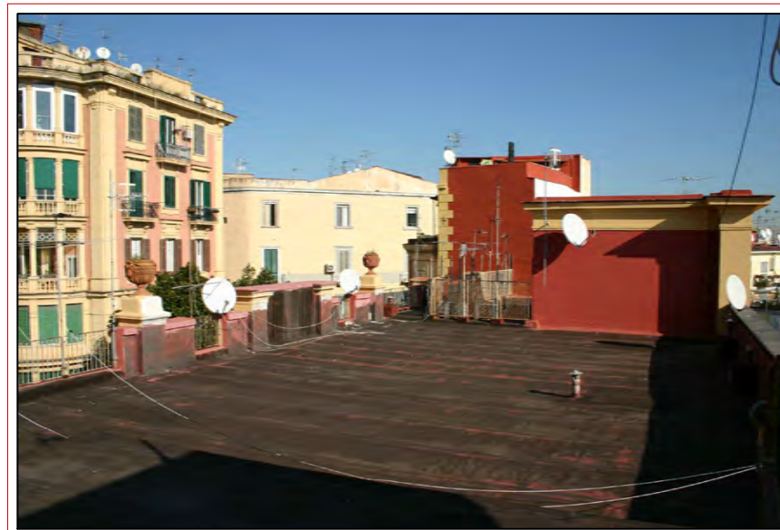
foto 6-LASTRICO SOLARE