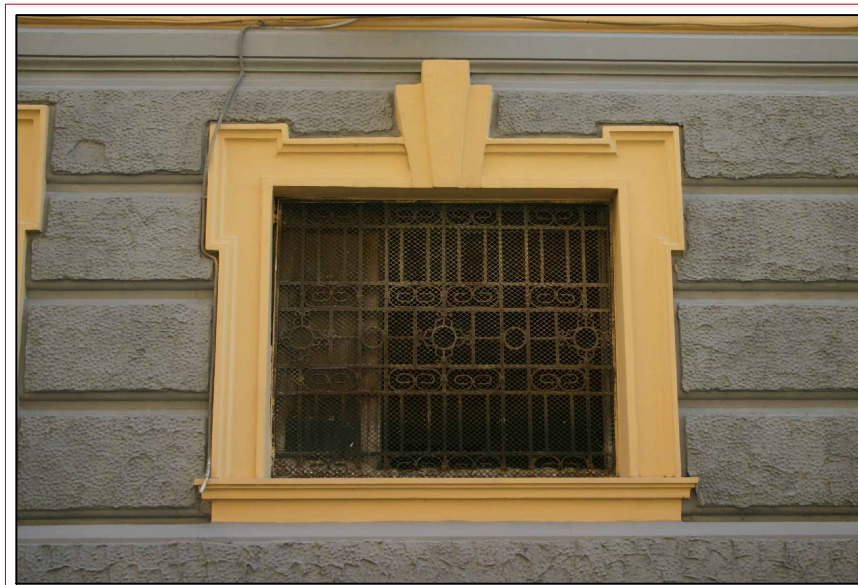
foto 10-CORNICE LUCERNAIO PIANO CANTINATO SU VIA S.CATERINA