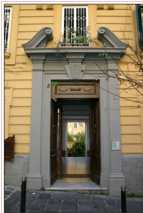
foto9-INGRESSO SU VIA S.CATERINA n.44