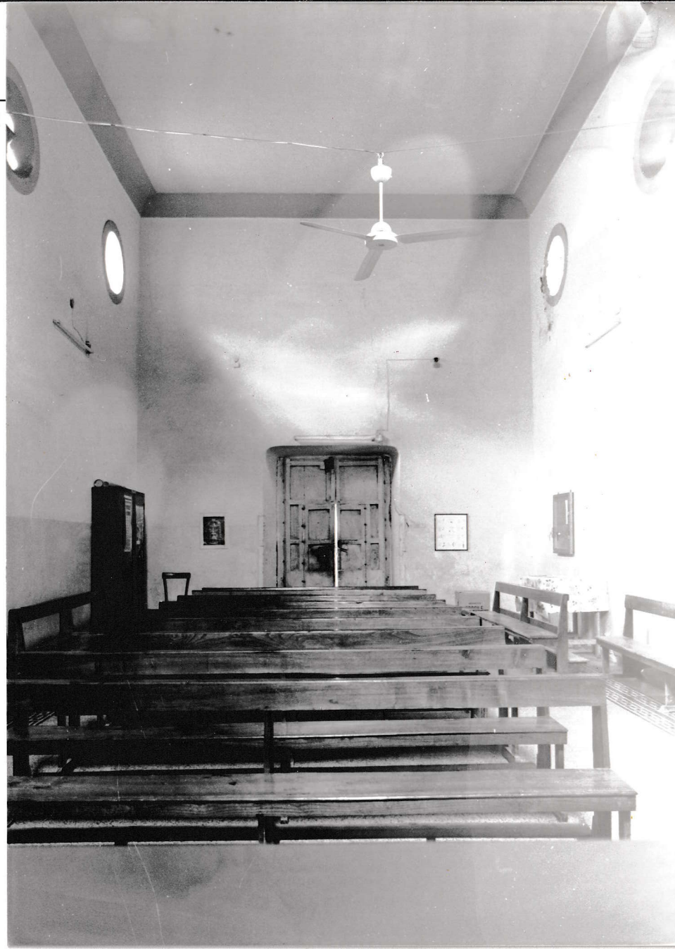
VITA DELL'ALTARE Ng / 02701