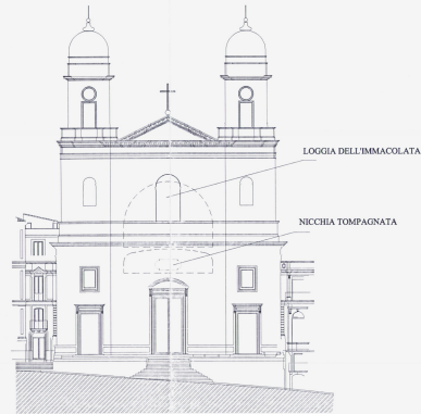
PROIEZIONE DELLA CANTORIA E DEL CORO