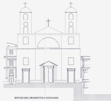
IPOTESI DEL PROSPETTO CRIGINARIO ANTE SECONDA META' DELL'OTTOCENTO