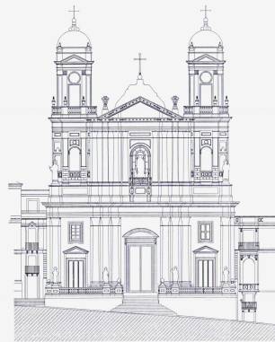
PROSPETTO ATTUALE SU PIAZZA S. FRANCESCO