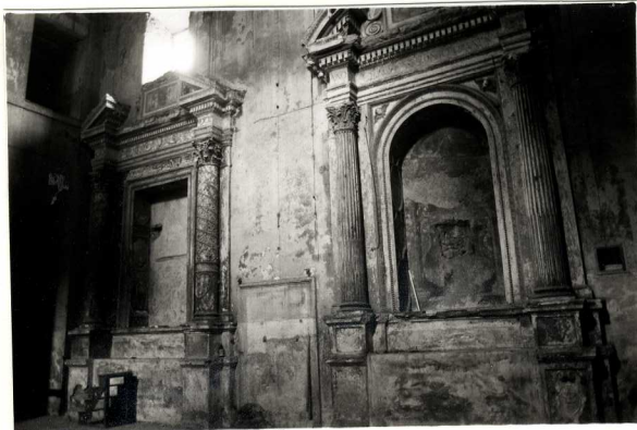
2. particolare parete sinistra