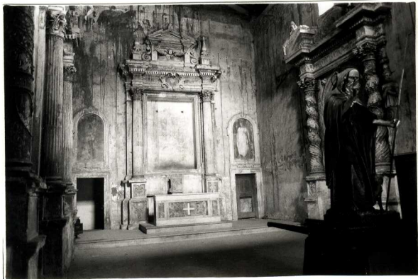
1. particolare altare maggiore