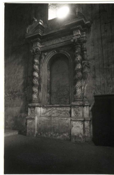
3. particolare 1° altare lato destro