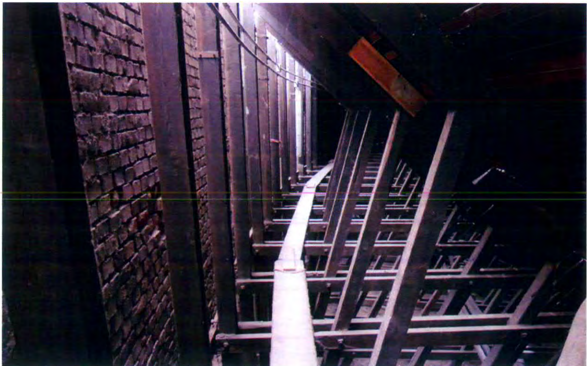
La pista in legno: vista della la curva verso via Giovanni da Procida e della struttura portante (settembre 2013)