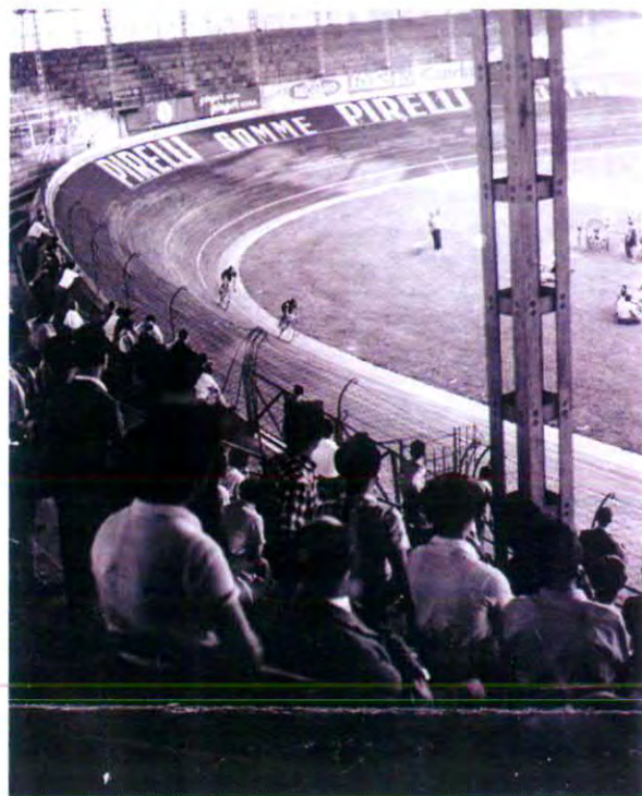
In alto: il Velodromo Vigorelli nel 1935