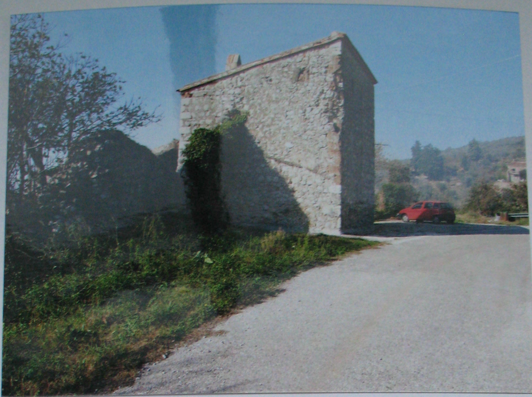
Comune di San Pietro Infine (CE) TORRI E CINTA MURARIA