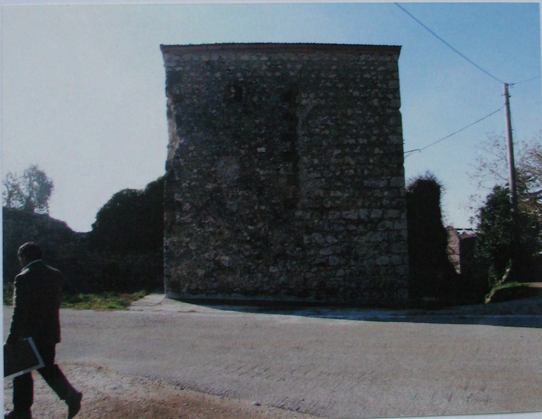
Comune di San Pietro Infine (CE) TORRI E CINTA MURARIA