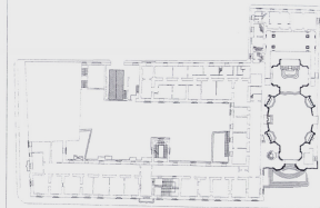
Piano scala 1:500