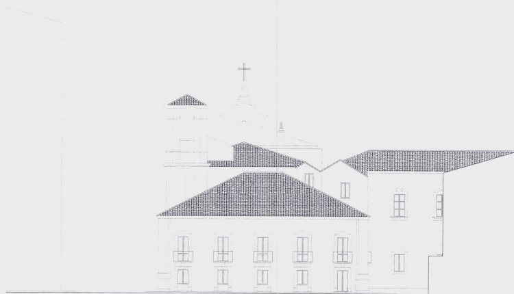
PROSPETTO VIA LA ROSA BUCCHERI