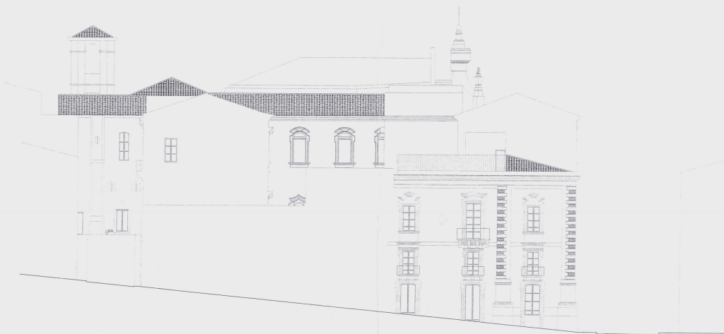
PROSPETTO VIA A. DI SAN GIULIANO