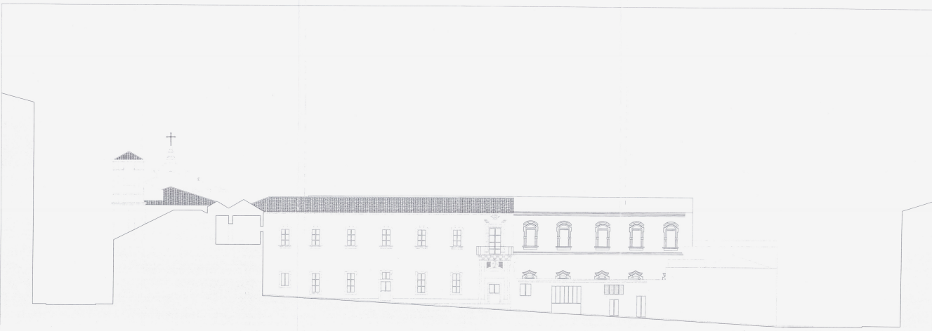
PROSPETTIVAZIONE VIA LA ROSA BUCCICCI