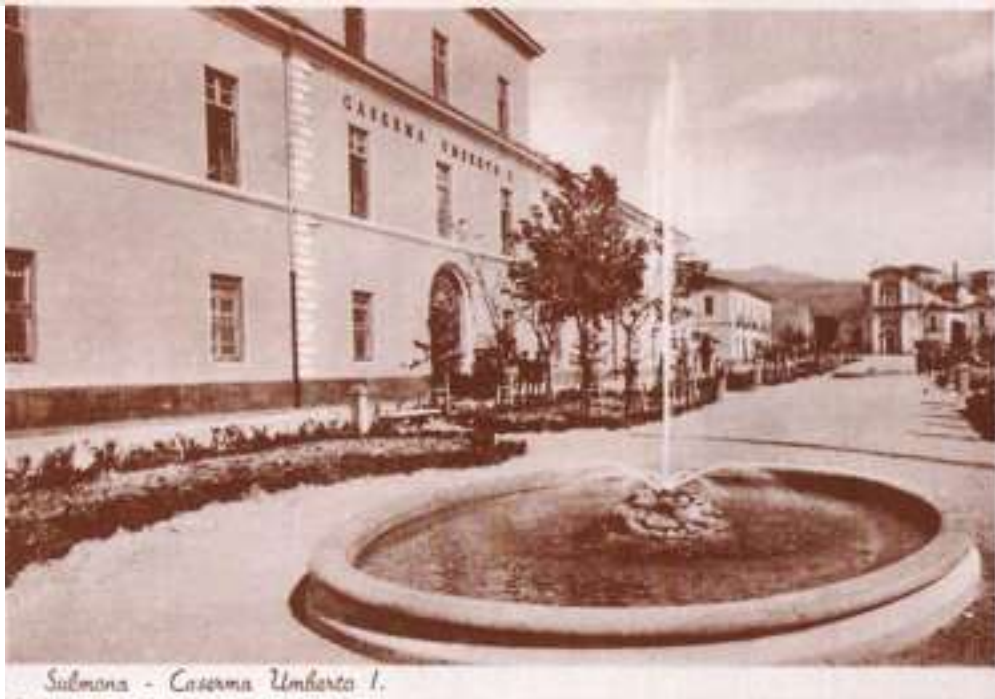
Sulmona - Caserma Umberto I.