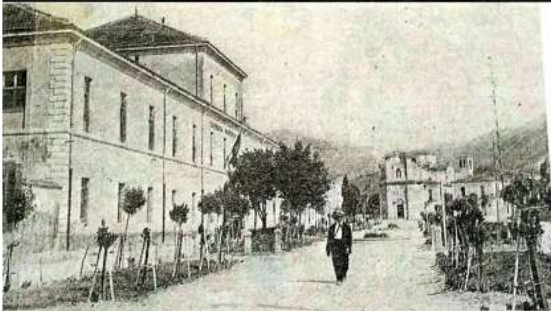
56 - Sulmona - Piazzale Vittorio Veneto con Parco della Rimembranza e Caserma Umberto