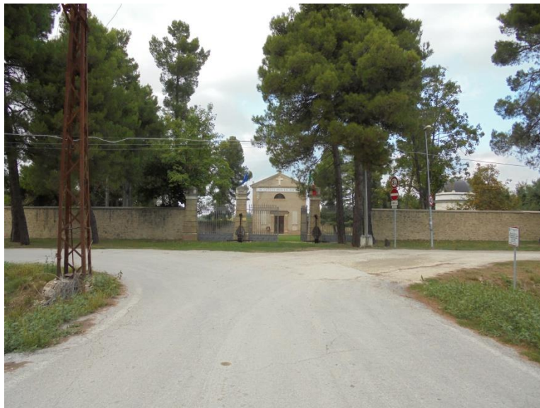
ingresso Parco della Rimembranza

Collocazione: SABAP Abruzzo con esclusione Aquila e comuni del cratere – Ufficio Catalogo