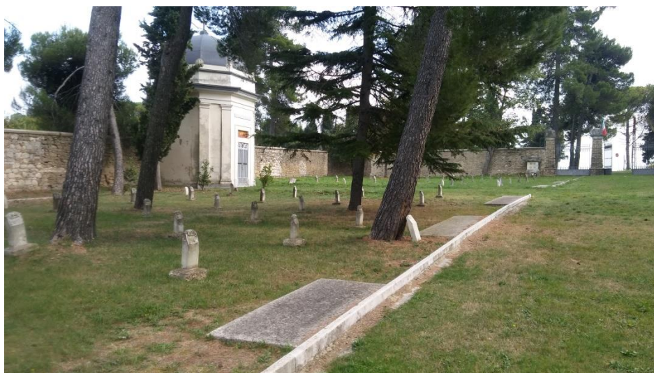
interno: lato destro e Cappella funeraria famiglia Paolucci