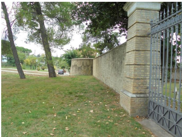
muro di recinzione: ingresso lato sinistro