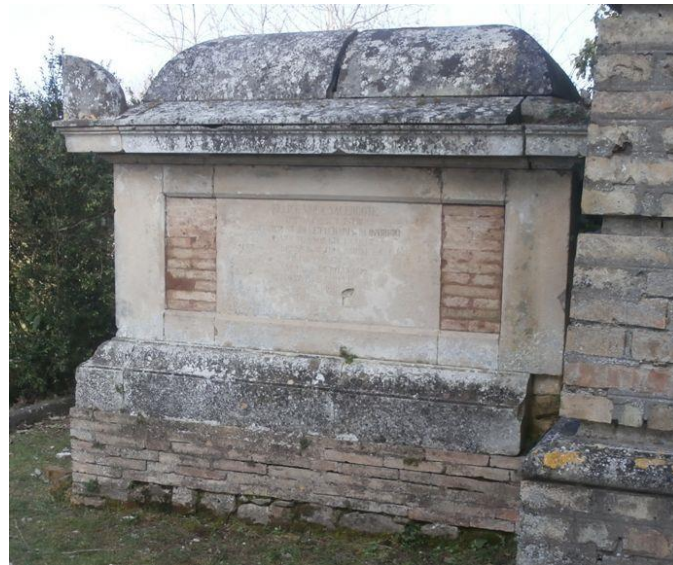
interno parco, a destra dell'ingresso: tomba del sacerdote Felice Mola