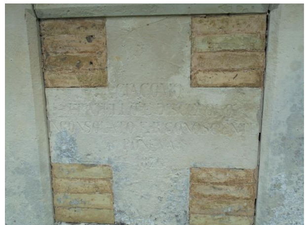
epigrafi sulla tomba del sacerdote Felice Mola