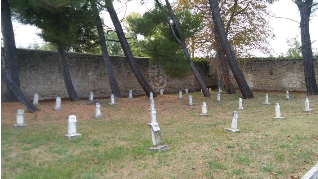
interno: lato sinistro