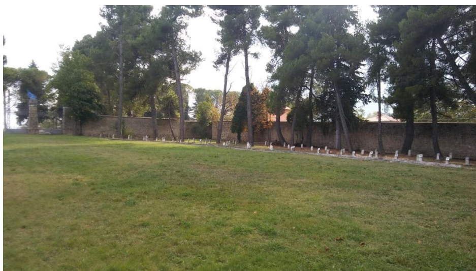
interno: lato sinistro