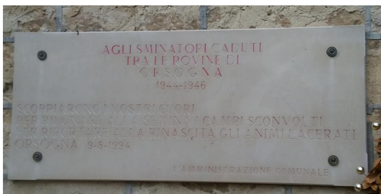
lapide, in marmo, dedicata agli sminatori caduti tra il 1944 ed il 1946, posta sotto la lapide dedicata ai caduti di tutte le Guerre