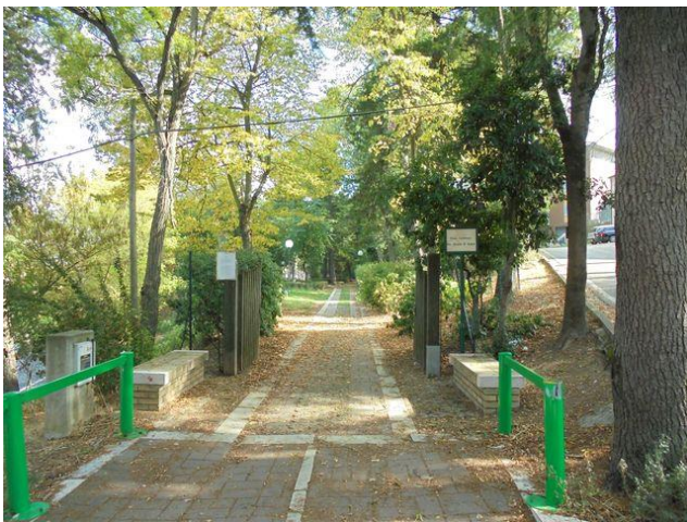
ingresso da Via Colle della Vittoria

Collocazione: SABAP Abruzzo con esclusione Aquila e comuni del cratere – Ufficio Catalogo