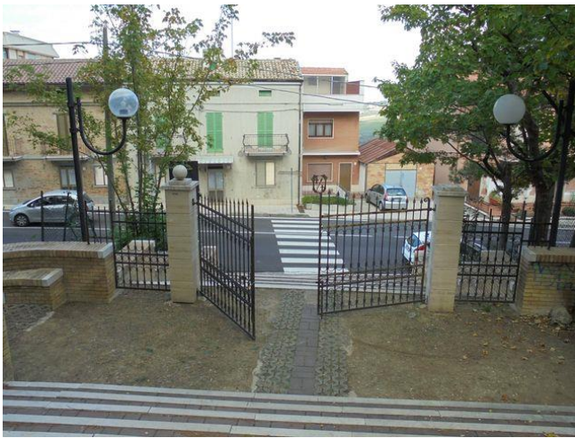
scalinata (Via Nazionale)