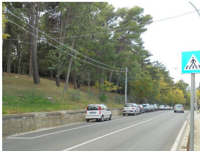
vista ovest da Via Nazionale