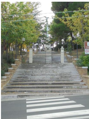
ingresso principale (Via Nazionale)