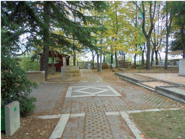
particolare pavimentazione antistante il monumento ai caduti