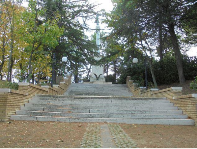
scalinata (Via Nazionale)