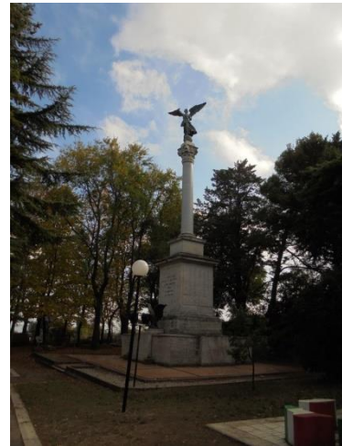
monumento ai caduti