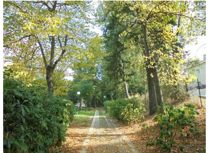
viale (Via Colle della Vittoria)