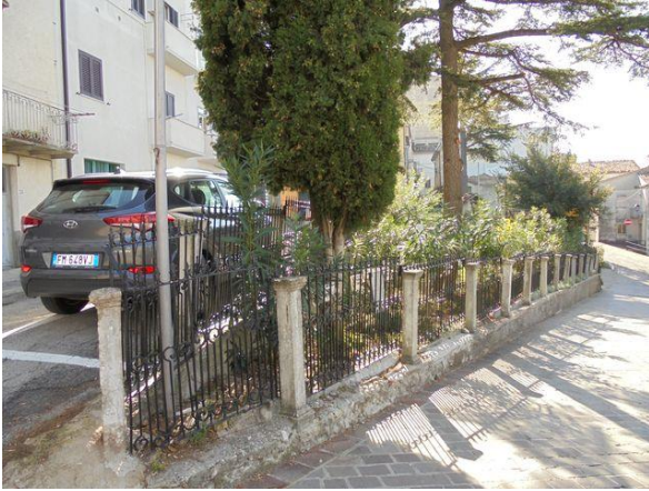
Parco vista Sud