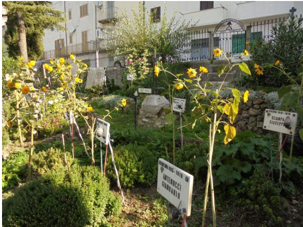
Interno Parco vista Nord-Est