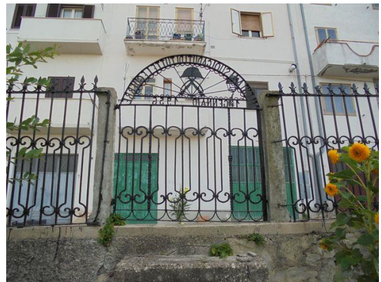
Ingresso secondario vista dall'interno del Parco