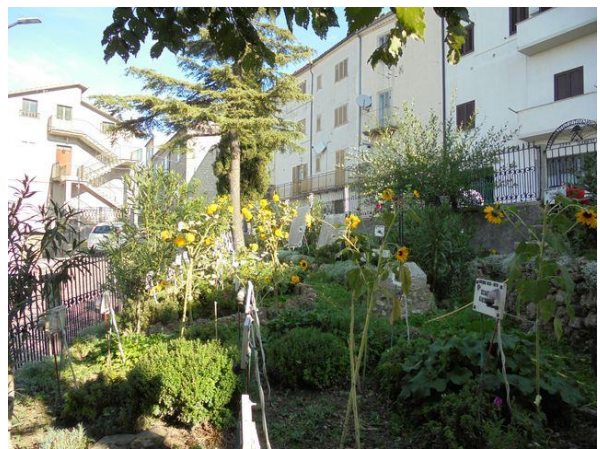
Interno Parco vista Nord