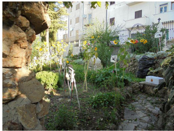
Interno Parco vista Nord-Est