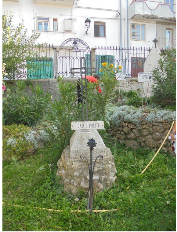
lapide vista Est