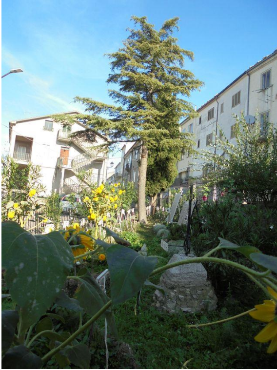
interno del Parco vista Nord