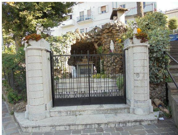
Ingresso principale Via G. Marconi

Collocazione: SABAP Abruzzo con esclusione Aquila e comuni del cratere – Ufficio Catalogo