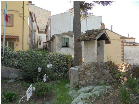
Interno Parco vista Sud-Est