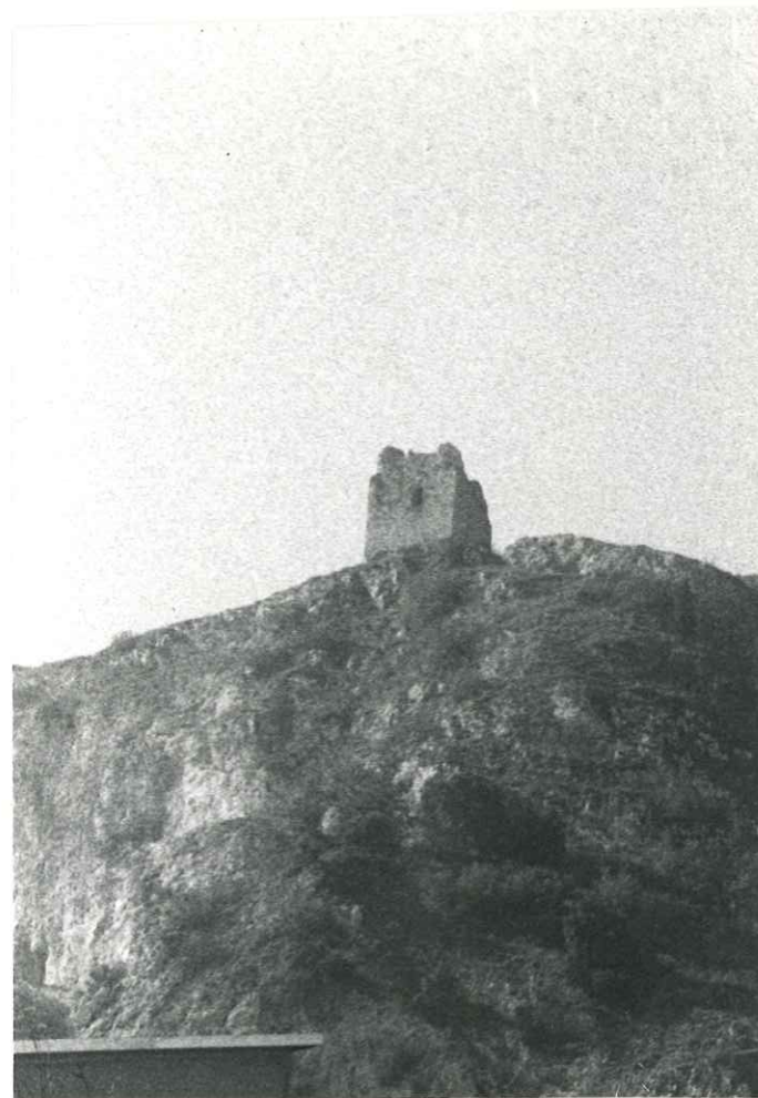
PARTICOLARE DEL LATO MONTEBELLO