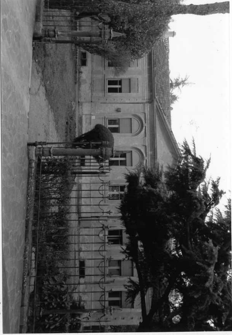
Prospetto laterale, su via