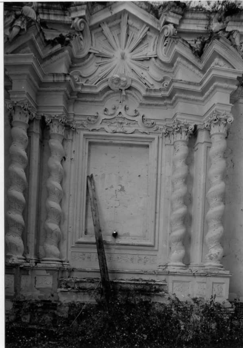
PARTICOLARE ALTARE LATERALE