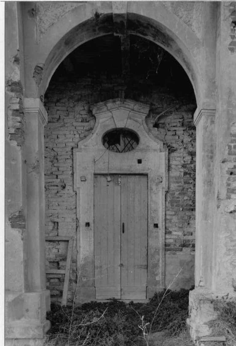
VEDUTE INTERNE DEL CORPO CHIESA