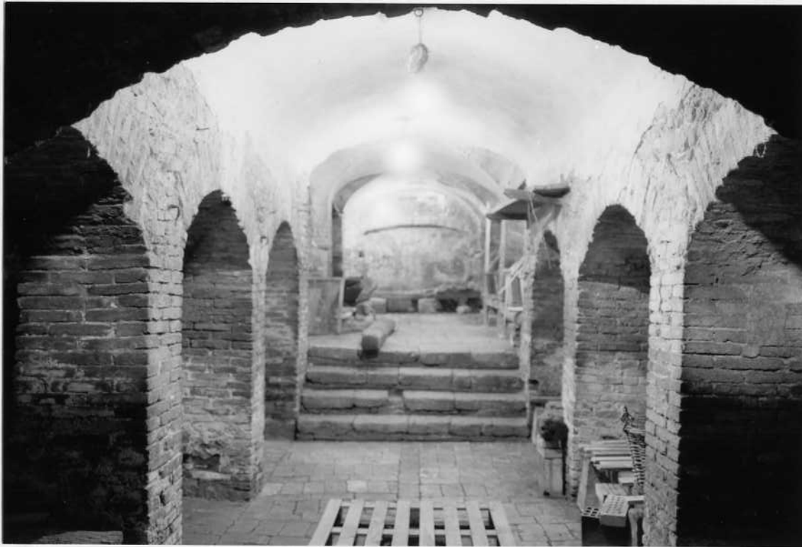
PIANO ANIMA VEDUTA D'INSIEME