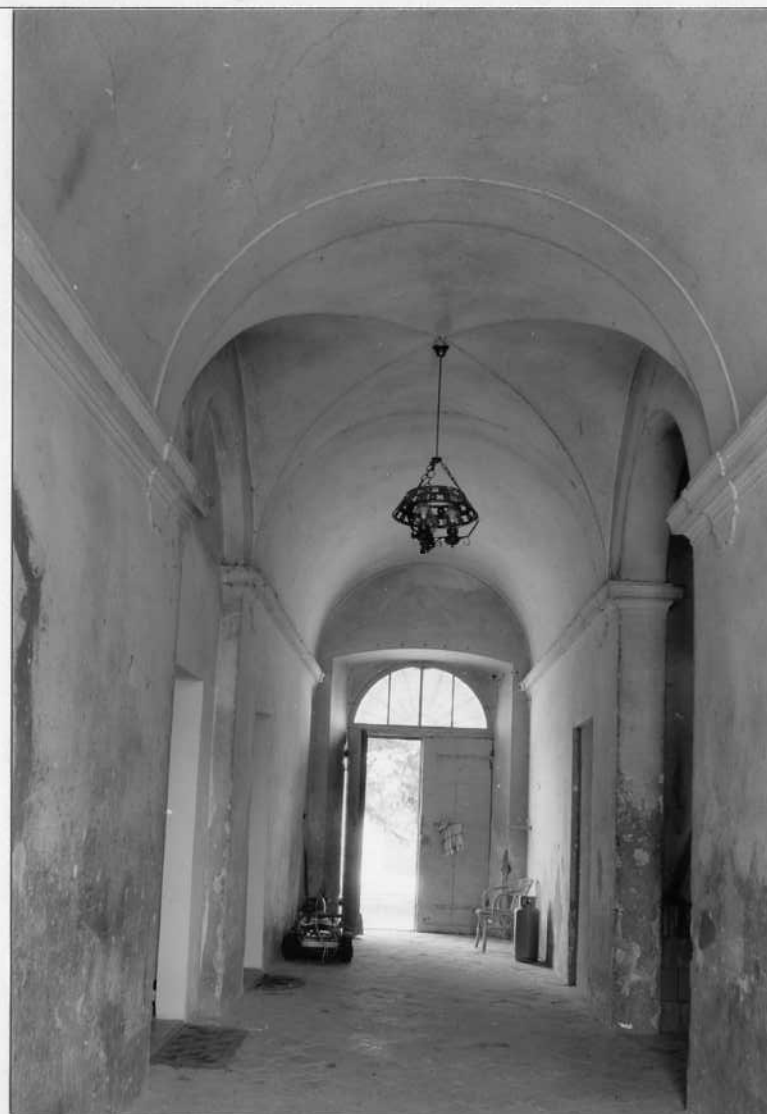
ANDRONE PASSANTE DI INGRESSO