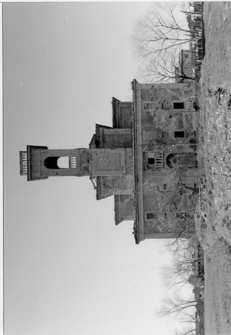
PROSPETTO DEL RETRO