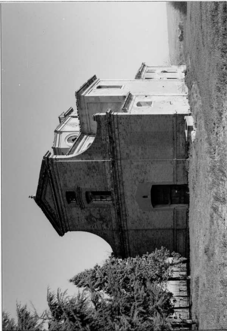
PROSPETTO DELL'EX EDIFICIO ECCLESIASTICO

ALLEGATO N. 5 SBAA RA 148782/86 (FO) MELDOLA - SARDAVILLA - COMPLESSO ARCHITETTONICO DEL CROCEFISSO