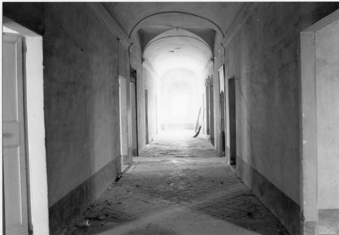
CORRIDOIO AL PRIMO PIANO - AFFACCIO DI TUTTI GLI AFFACCI