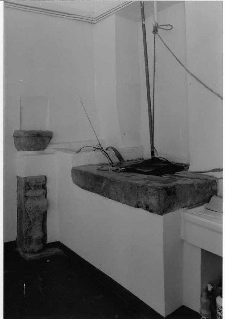
PIANO TERRA - POZZO ED ELEMENTI IN PIETRA