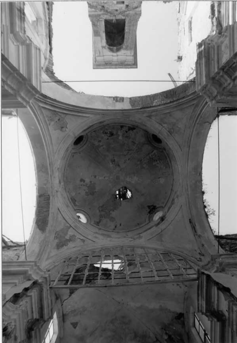
PARTICOLARE DELLA "COPERTURA"