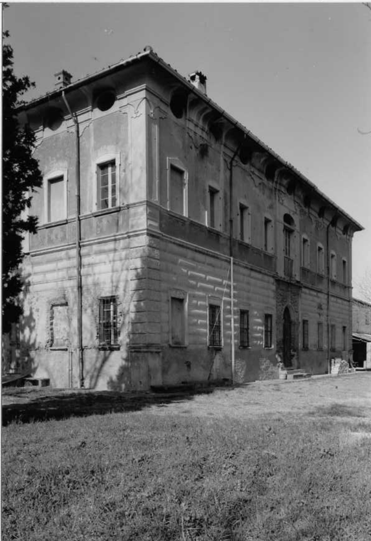
PARTICOLARE DELLA FACCIATA DELL'EDIFICIO