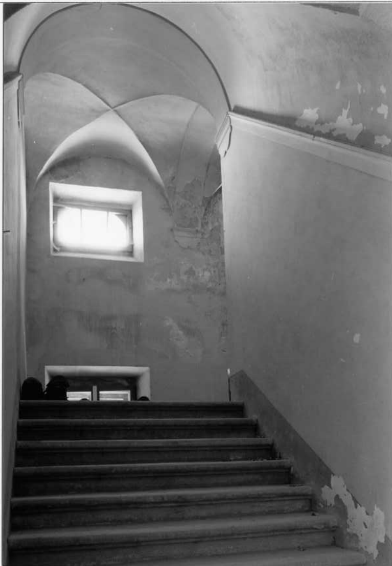
VEDUTA DELLO SPAZIO VERSO IL PIANO PRIMO

ALLEGATO N. 4 SBAA RA 418790/91 (FO) MELDOLA-SCARDAVILLA - COMPLESSO ARCHITETTONICO DEL GROCEFISSO