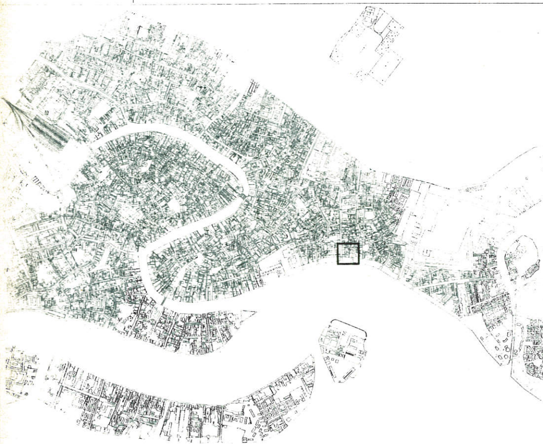
POSIZIONE DELL'ESTRATTO MAPPALE IN VENEZIA