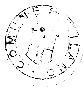
Bollo del Comune.