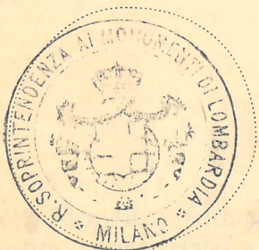
Bollo dell' Ufficio.