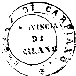
Bollo del Comune