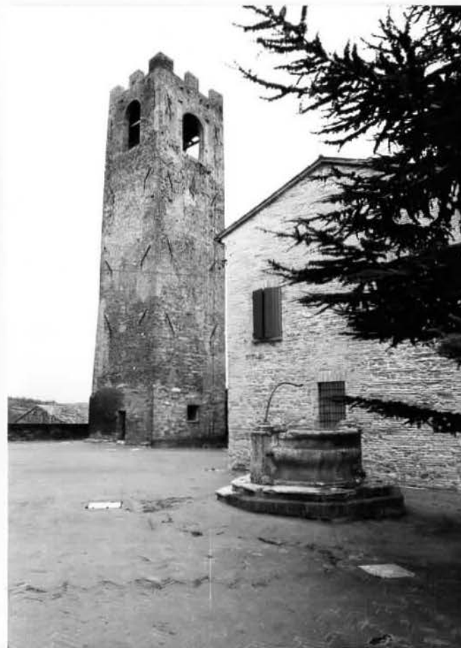
CORTE E TORRE