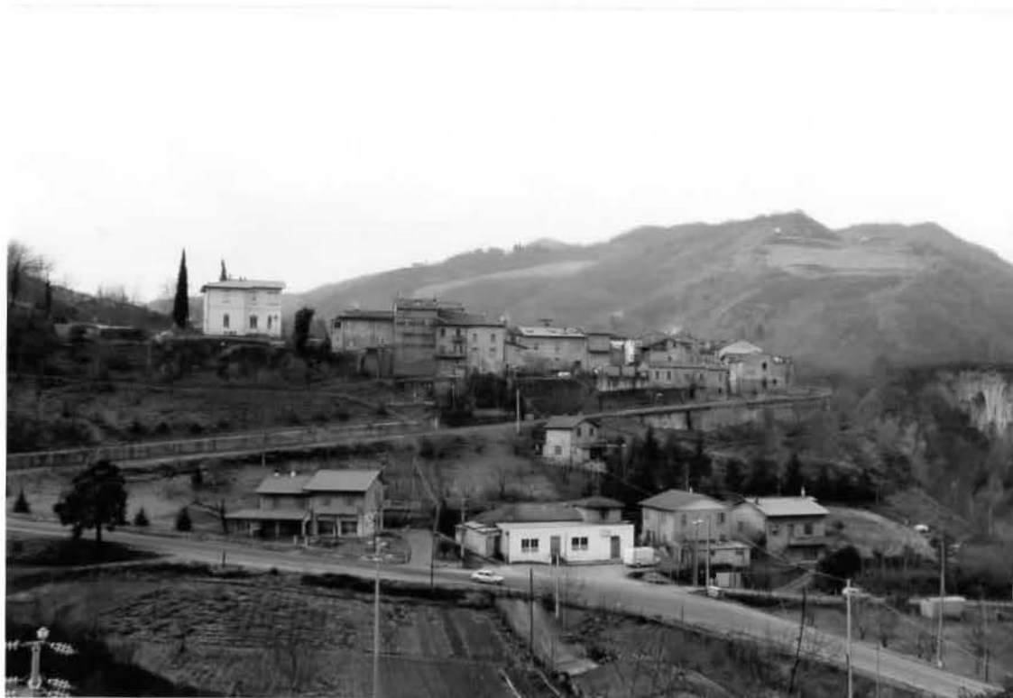
Vedute d'insieme dell'insediamento