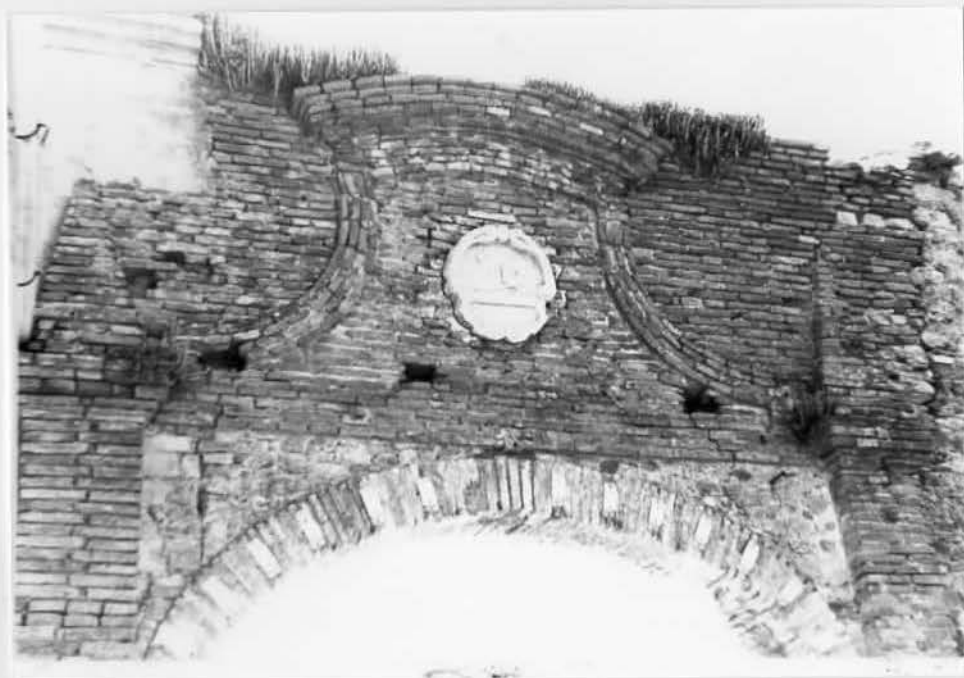
Fronte: particolare della cimasa 57023