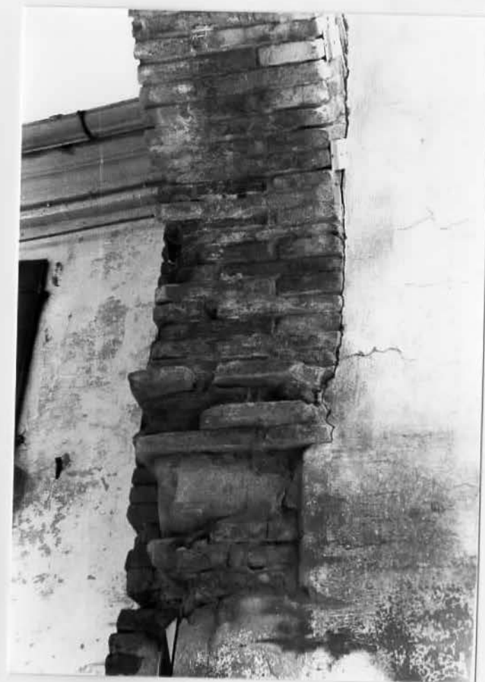
Particolare del fornice 57024