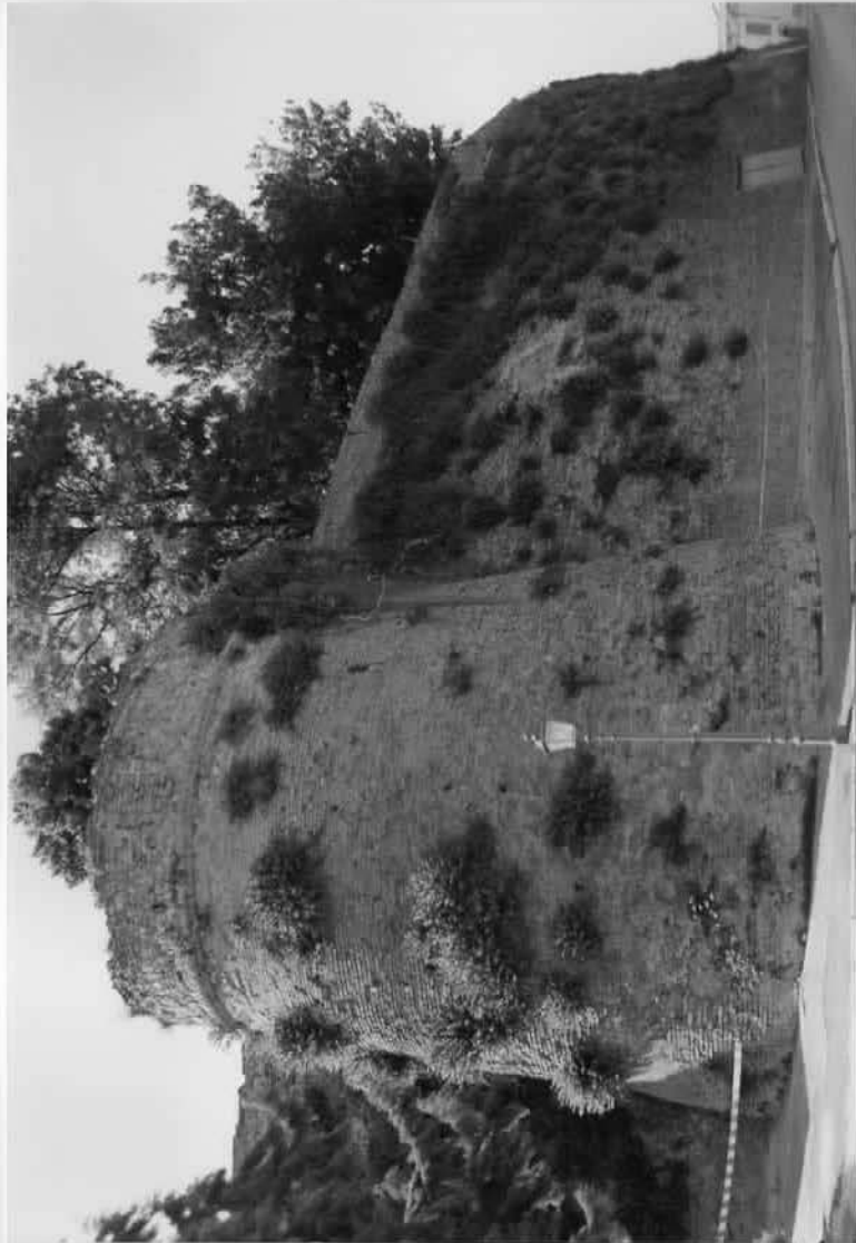
CINTA MURARIA DELLA ROCCA