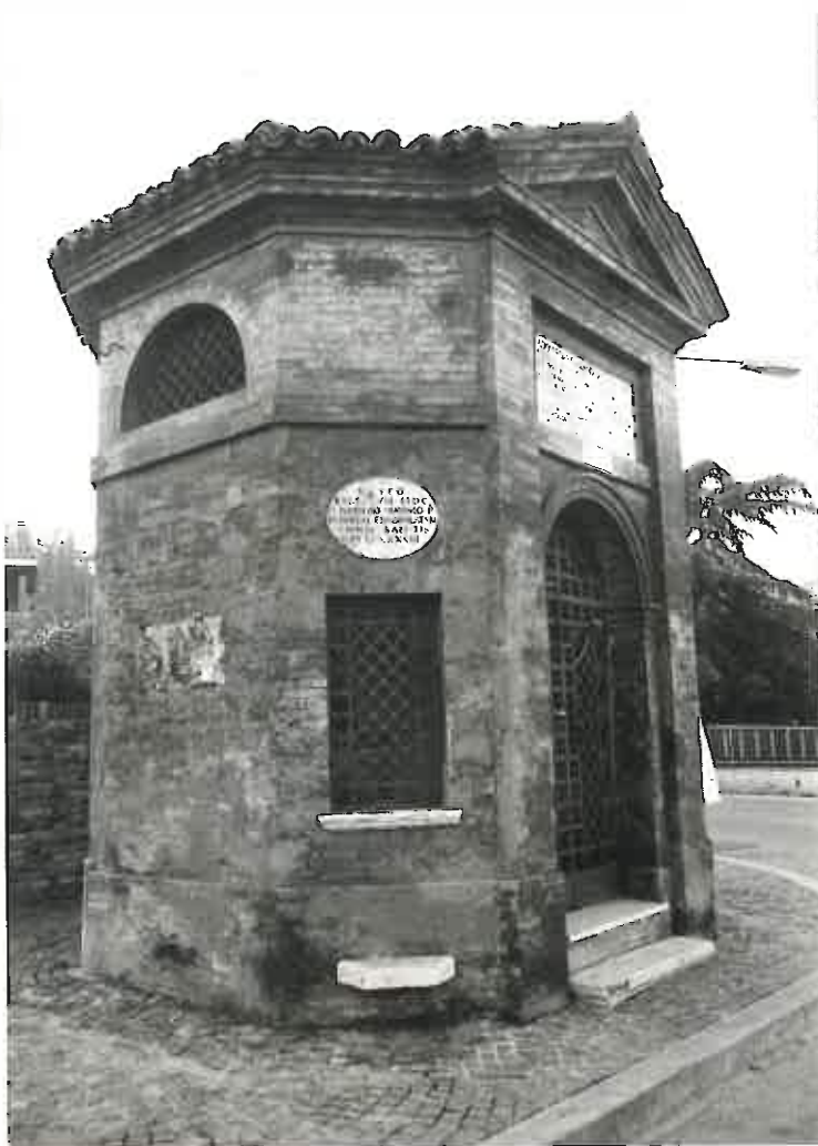
CELLETTA MASINI EX 173354 FOTO DIG. 001295 FCLES07