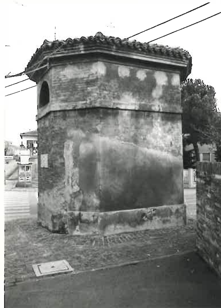
EX 173355 ARSIDE FOTO DIG. 001296 FCLES07