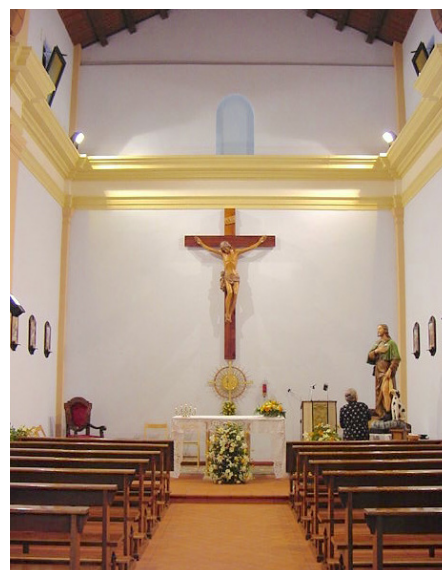
L'interno dopo i lavori.