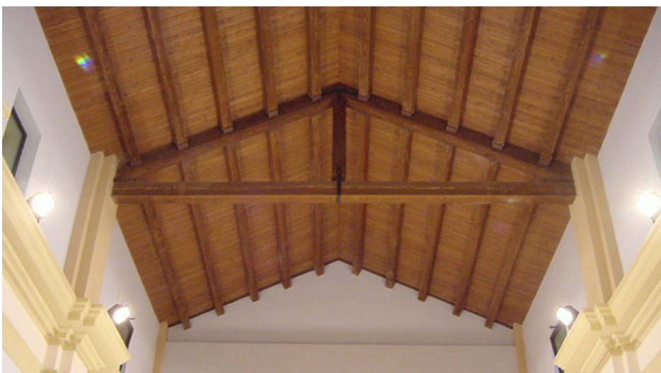
La copertura in legno della chiesa.