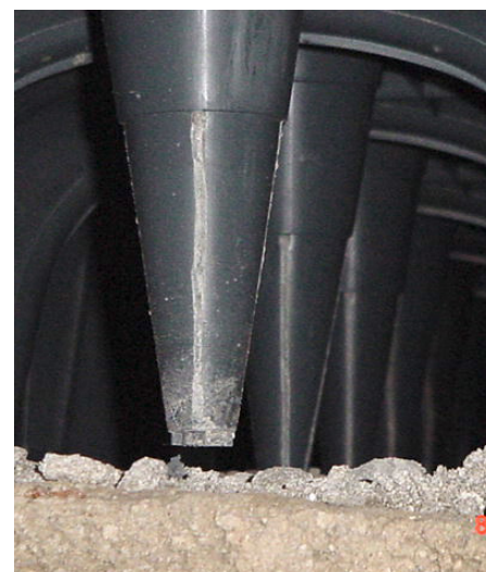
Aerazione dei pavimenti con l'impiego di cupolex.

Gli interventi eseguiti per la salvaguardia del monumento oramai in disuso consistono in: ricostruzione del tetto; consolidamento e restauro della facciata su Via Roma e quella principale sulla centrale piazza del Comune; ricostruzione parziale e restauro della cornice interna; restauro e rifacimento degli intonaci modanati; deumidificazione da umidità ascendente delle pareti verticali; restauro del portone ligneo; demolizione pavimento e massetto esistente; scavo terreno per un'altezza di 40 cm.; costruzione vespaio; costruzione massetto armato; costruzione massetto sottopavimento; costruzione pavimento in cotto; demolizione rinzafo e ricostruzione intonaci; restauro delle paraste lesene; nuovi infissi; costruzione impianto elettrico e di illuminazione a norma; intonaco macroporoso; tinteggiature varie; restauro altare per poter officiare; costruzione nuovo altare; ricostruzione del coro mediante il consolidamento e restauro delle colonne residue; costruzione della scala in legno; costruzione del solaio con relativo pavimento nonché la balaustra a colonnine; decorazioni varie all'interno; riprese varie di muratura a cucu scuci; consolidamento, restauro e lavaggio paramento murario.