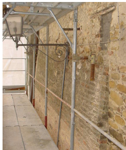
Prima dei lavori.