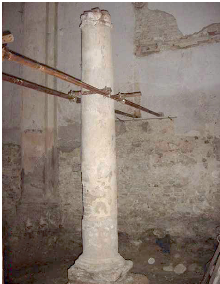
Prima dei lavori.