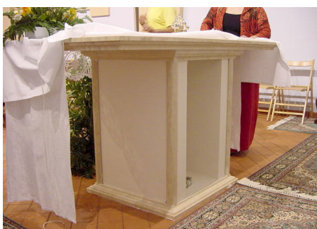
L'altare dopo i lavori.