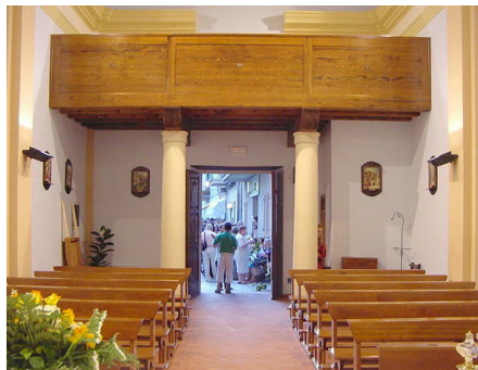
Dopo i lavori.