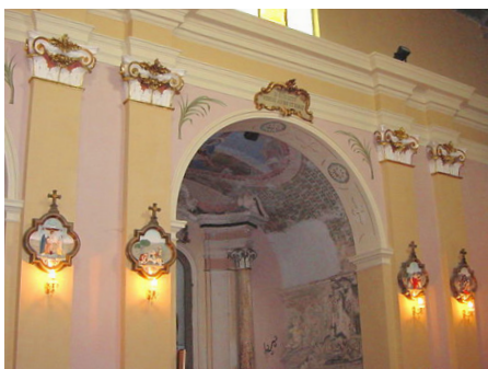
Particolare dell'interno dopo i lavori.