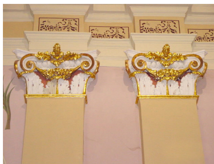
Particolare dopo i lavori.