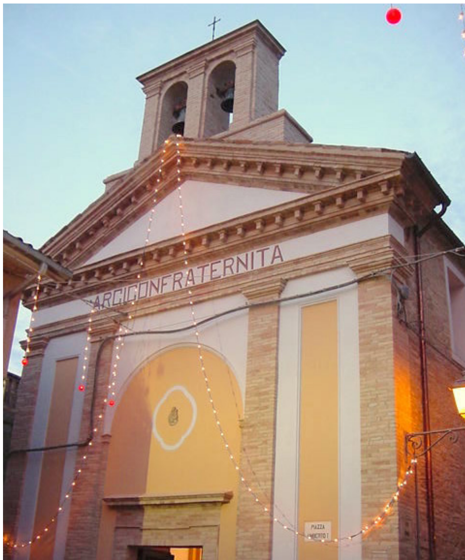
La facciata principale della chiesa dopo i lavori.

La chiesa di S. Rocco è la "Cappella" (detta anche Oratorio) propria dell'Arciconfraternita S. Monte dei Morti, sorta nella seconda metà del sec. XVIII, ad unica navata, organo e campaniletto a bifora. È una semplice struttura, quasi priva di ornamenti, che tuttavia si impone nell'immagine urbana sia per la sua posizione sulla piazza sia per la facciata nella quale le paraste sorreggono la cornice nella quale si legge la proprietà della Chiesa. All'interno pilastri e paraste sorreggono un grande coronamento di cornici mentre in alto ampi finestroni consentono l'illuminazione naturale dell'aula. La copertura a due falde cadde per rottura di una trave che sfondò la sottostante lamia decorata 1911-1912 dal pennese Bellante; venne ricostruita con il contributo popolare nel 1953, ma cause naturali e la noncuranza ne hanno provocato il degrado con conseguenze disastrose per tutta la struttura del fabbricato.