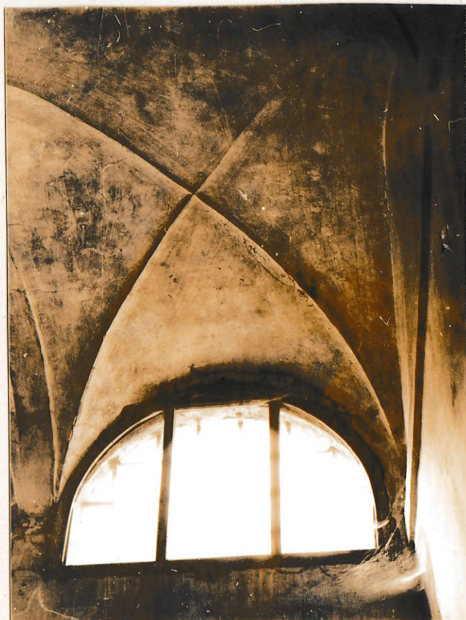
Volta a crociera (scale del fabbricato principale, già adibito ad abitazione)