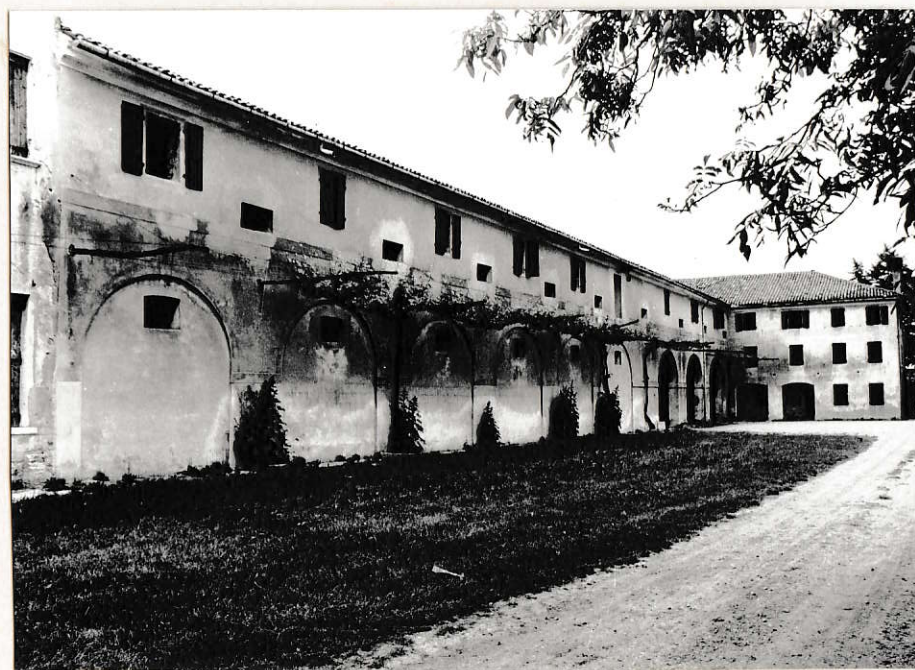
Facciata Sud e Sud-Est