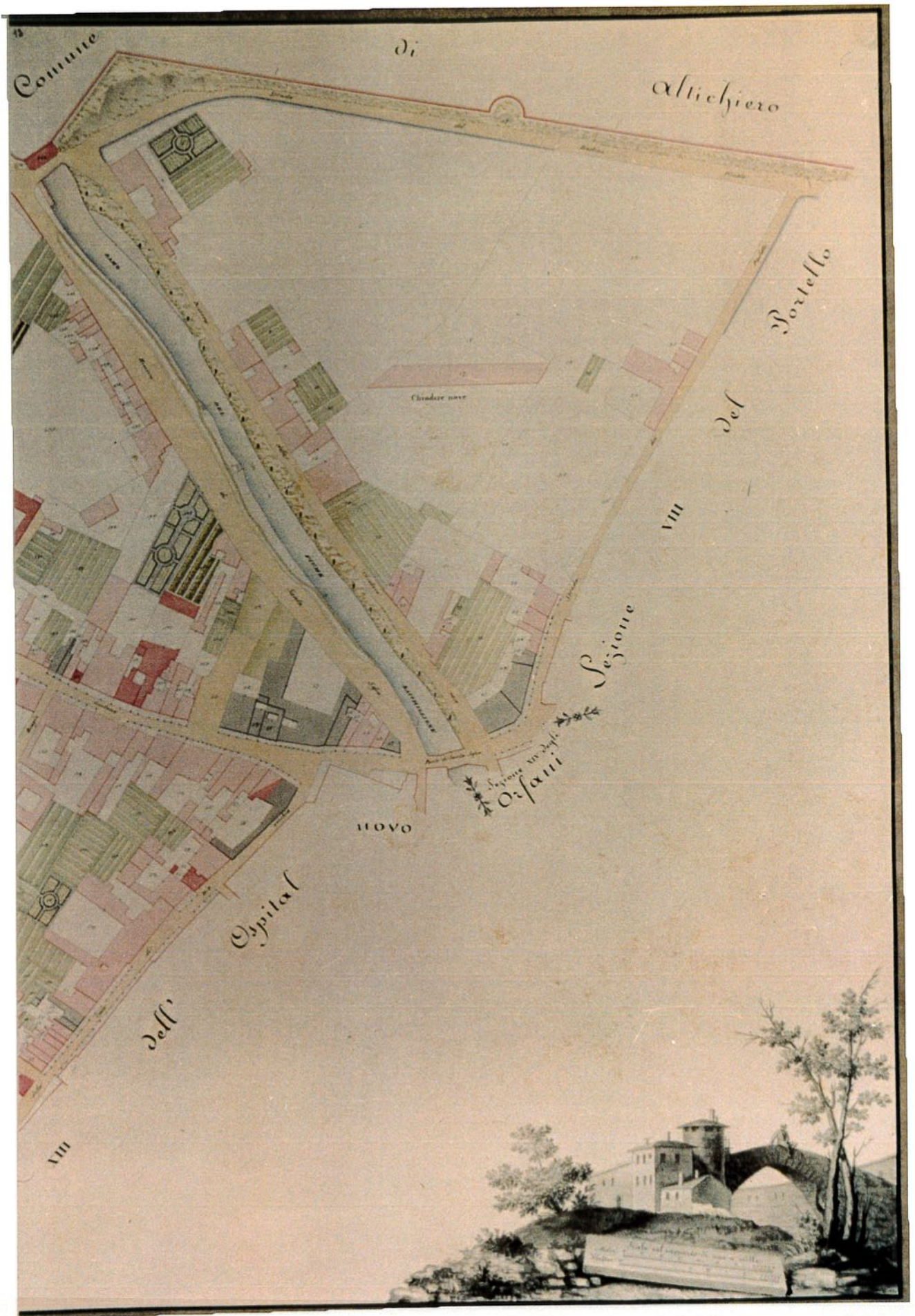
GIARDINO DI PALAZZO PRIULI, PISANI CORNARO, ora PROPRIETA' PIZZO, VIA ALTINATE 141, VIA MORGAGNII.

All.5 - Fotocopia Sezione VII della Mappa catastale della città di Padova divisa in venti sezioni, di G.Tanzi, 1820