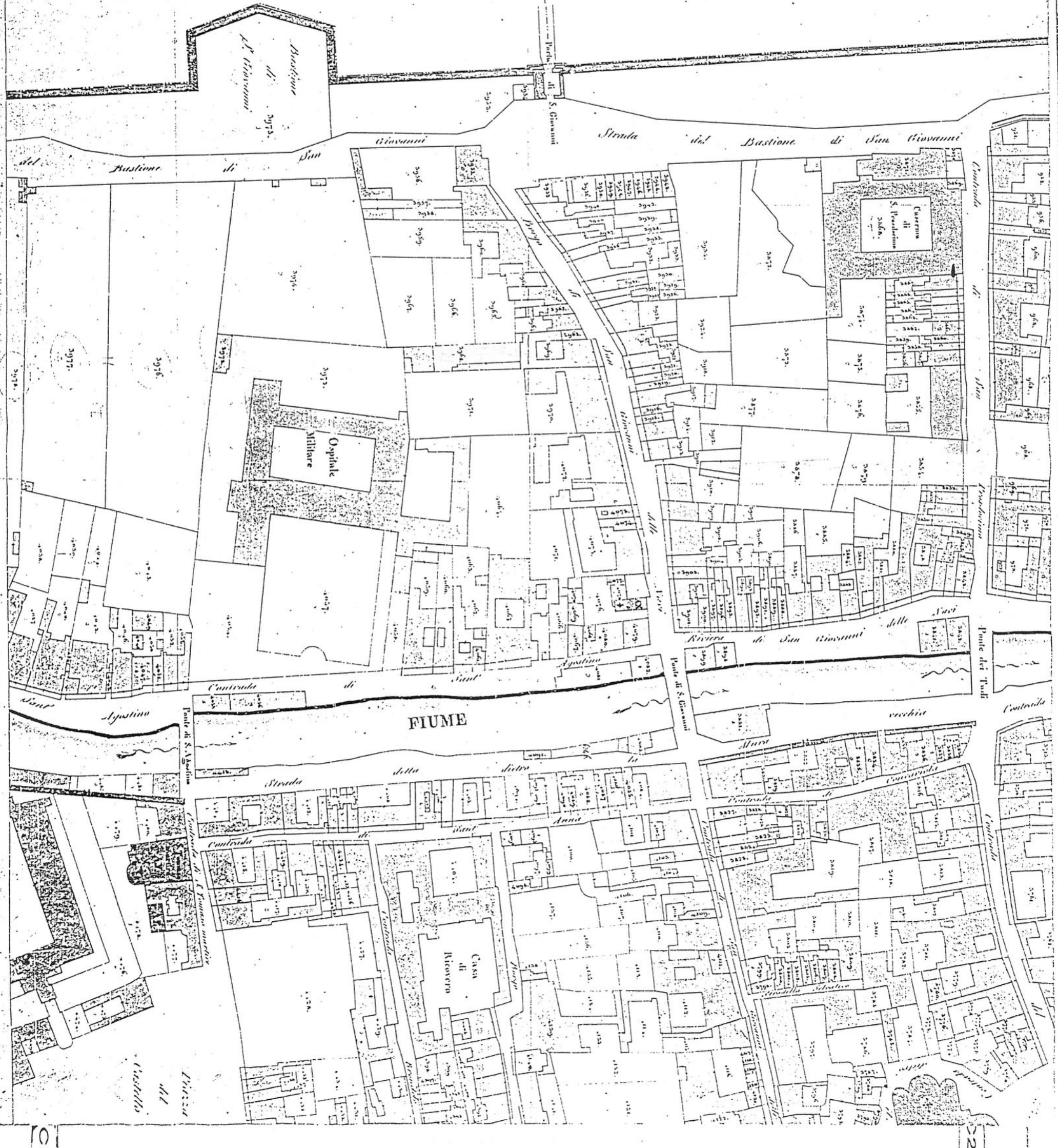
GIARDINO DI PALAZZO LION, MEDIN ora PASETTI, VIA LUGANEA 37. All. 6 - Fotocopia sez. XI della mappa catastale austriaca di Padova e Provincia, 1828 - 1845