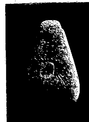
Neg. 13833 X