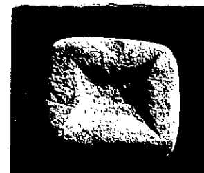
Neg. 13834 X