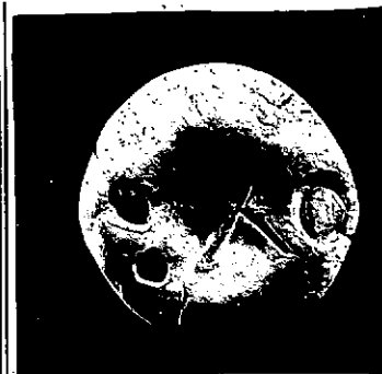
Neg. 13853 X