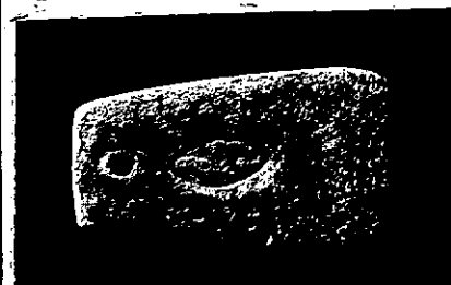
Neg. 13844 X