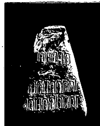
NEG. 13839 X