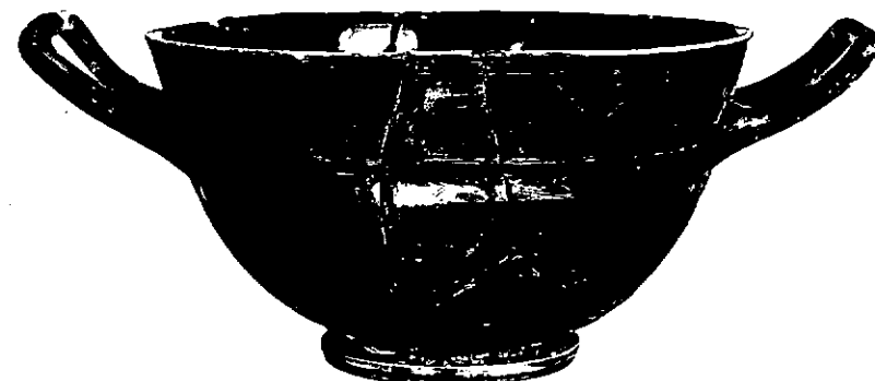
NEG. 9931 X