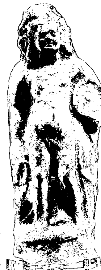
Fig. Stato - S. (c. 250.000)