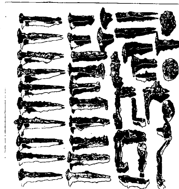
Neg. 10642 X.

DESCRIZIONE: Trattasi di n.90 pezzi di cui: 14 interi; 8 privi di capocchia a forma di L; 14 capocchie di vario diametro; 13 privi della parte terminale; 6 privi della capocchia e della parte iniziale; 35 frammenti vari.