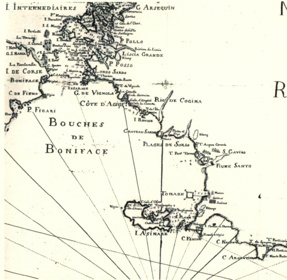
Carta della Sardegna di François Giaume del 1813. Torino, Archivio di Stato. Particolare.

(5605238) Roma, 1975 - Ist. Poligr. Stato - S. (c. 400.000)