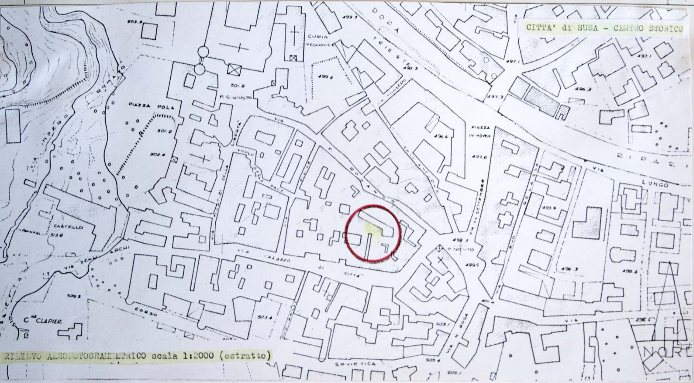
RELIEVO AEROFOTOGRAFOMETRICO scala 1:2000 (estratto)

ALLEGATO N. 2 Città di Susa - Centro storico