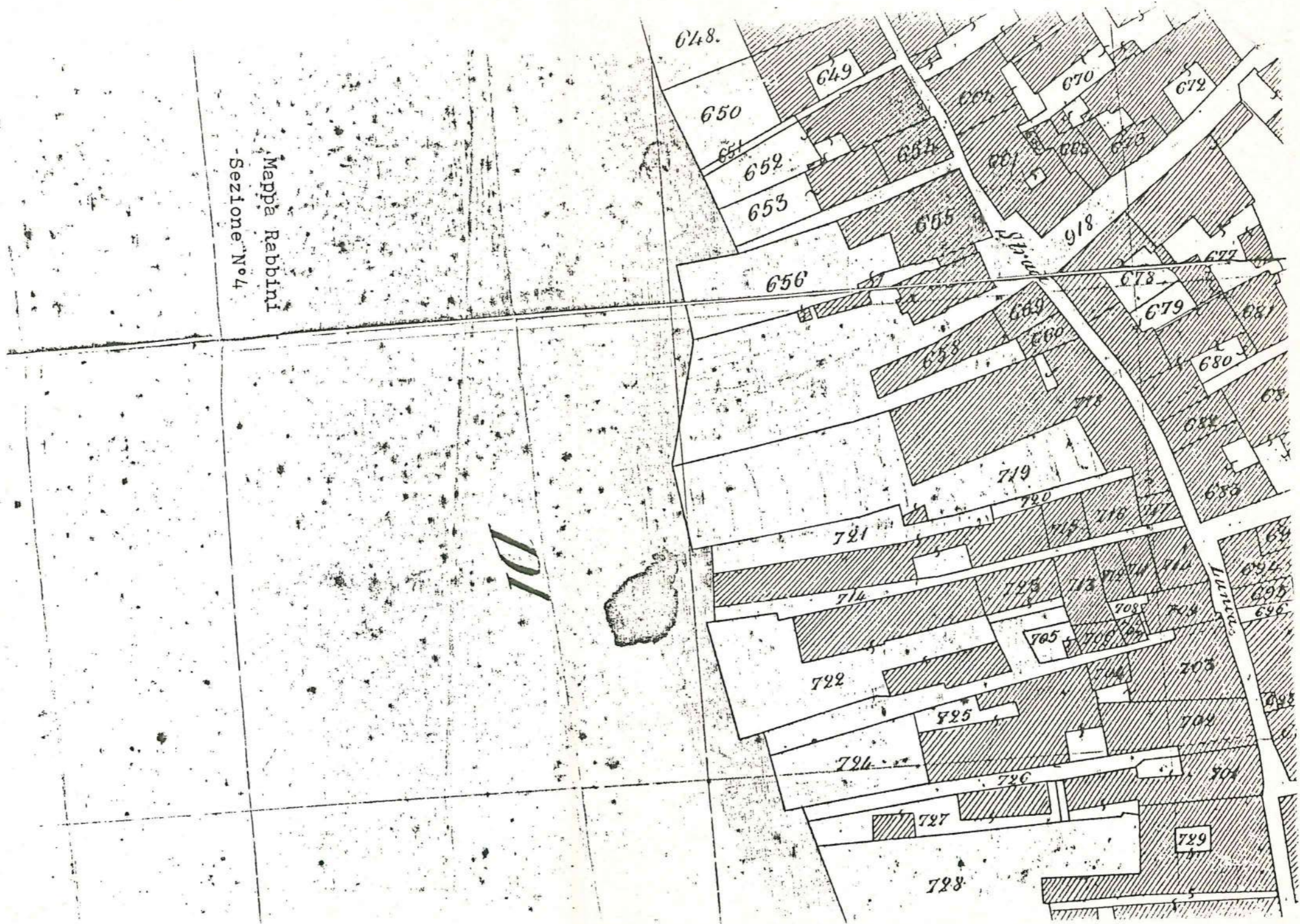
Mappe Rabbinici - Sezione N° 4

(5605238) Roma, 1975 - 1st. Poligr. Stato - S. (c. 400.000)