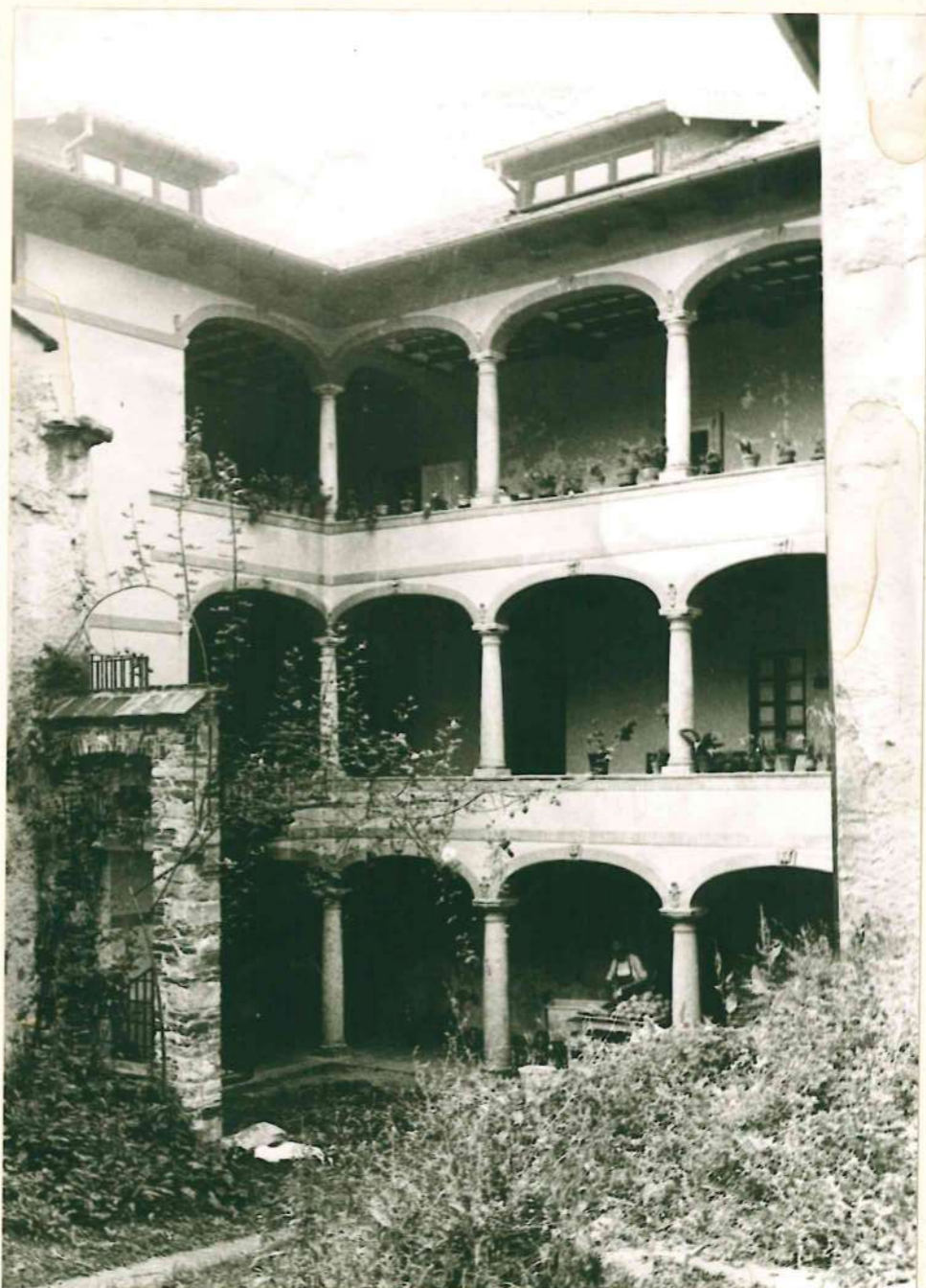
CASA BIANCHI VERGANI