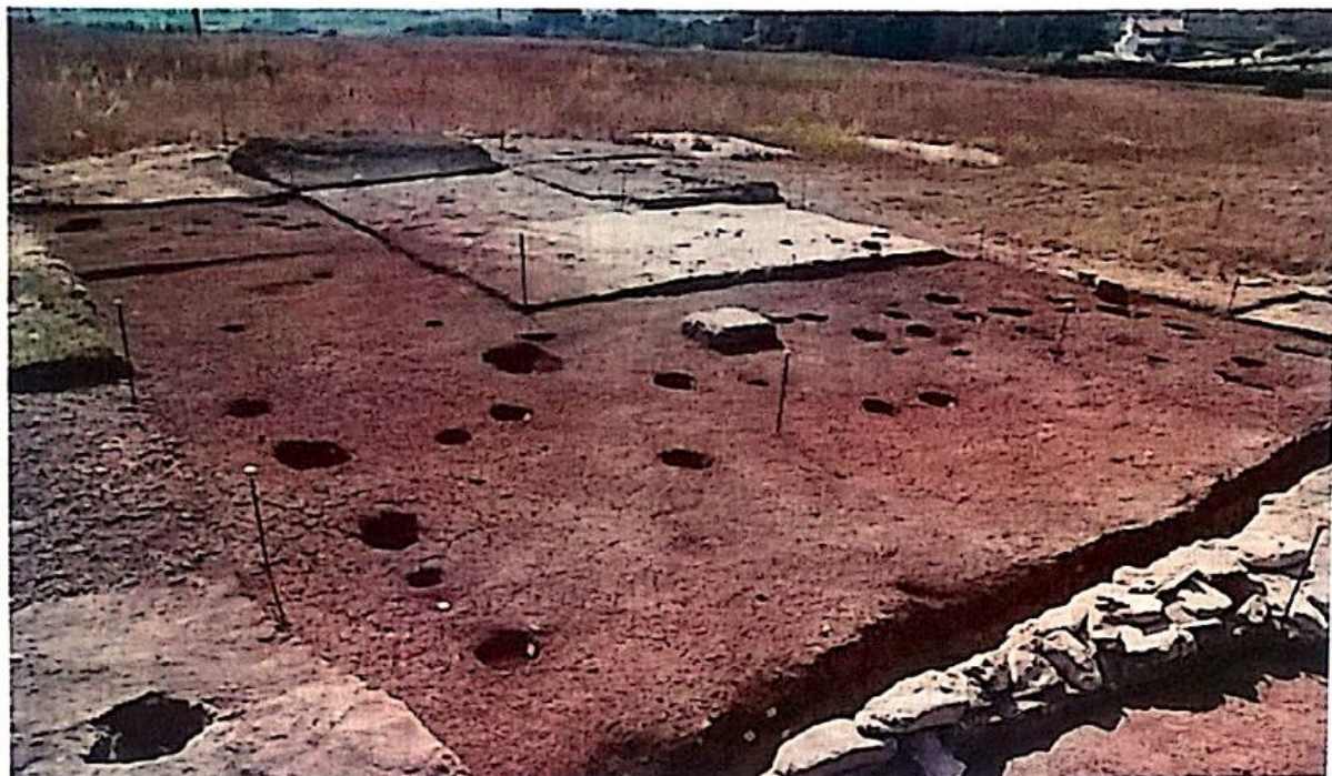
particolare di un'area di scavo, con buche per palo.

terra battuta e concotto, buche per palo, tracce di intonaco e grandi contenitori infissi nel piano di calpestio 1 .