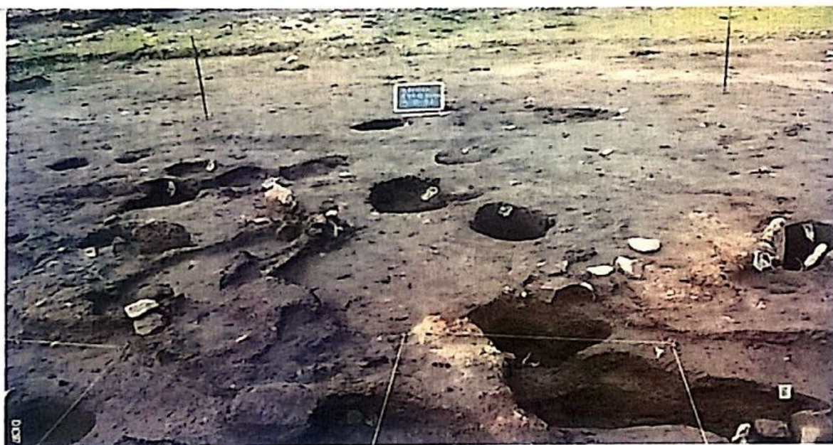
particolare di scavo.

Tra i resti della cultura materiale sono stati rinvenuti: vasellame in ceramica d'impasto, un modellino fittile di capanna, una figurina fittile antropomorfa e una zoomorfa, fuseruole, resti di fornelli fittili, alari di terracotta, pesi da telaio e un frammento di spada in bronzo.