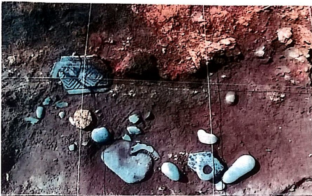
ritrovamenti in corso di scavo.

Spesso all'interno delle capanne si possono distinguere zone di servizio, zone destinate alla cottura e magazzini. L'alzato, invece, era realizzati con pareti di pali, paletti, canne e rami rivestiti da un impasto di argilla e paglia, utile per impermeabilizzare la struttura.