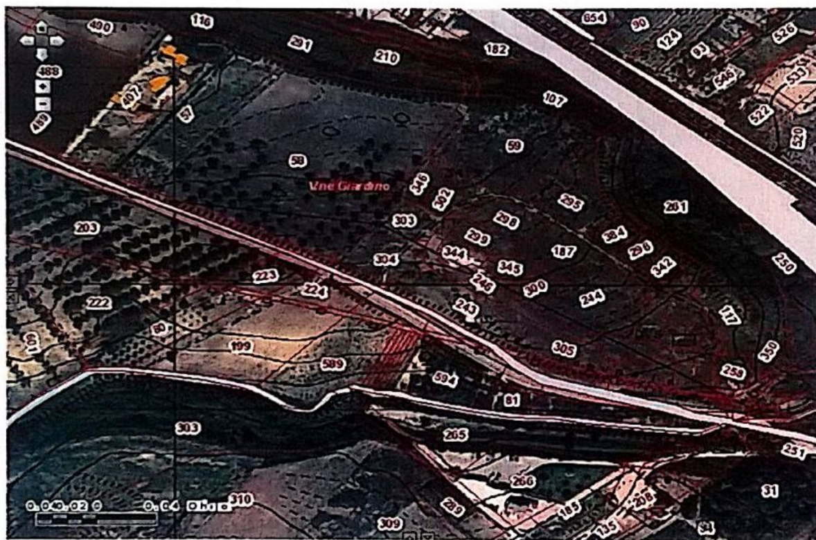
Stralcio del catastale con ortofoto.

L'area oggetto d'indagine si trova a E dell'attuale abitato, lungo la Strada Comunale dei Giardini, a quota 30 m circa s.l.m. Dal punto di vista geomorfologico, è inserita in un'area che si estende dal Biferno al Fortore costituita da diverse piattaforme lungo il litorale, delimitate da canali che sboccano verso il mare. In particolare, il sito è circoscritto a E e SE dal Vallone del Giardino, a N dal costone naturale che lo separa dalla costa.