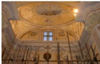
IMPALCATURA NEL TRANSETTO