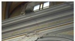
LUNETTA NAVATA CENTRALE