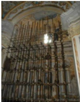
IMPALCATURA A SOSTEGNO DELLA VOLTA DEL TRANSETTO