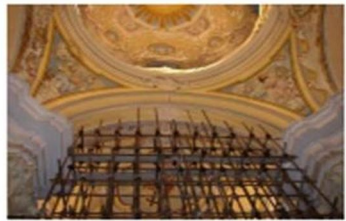
IMPALCATURA A SOSTEGNO DELL'ARCO