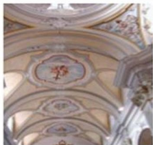
VOLTA NAVATA CENTRALE