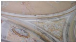
CUPOLA NAVATA LATERALE